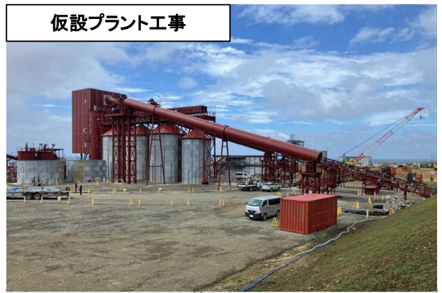
仮設プラント工事