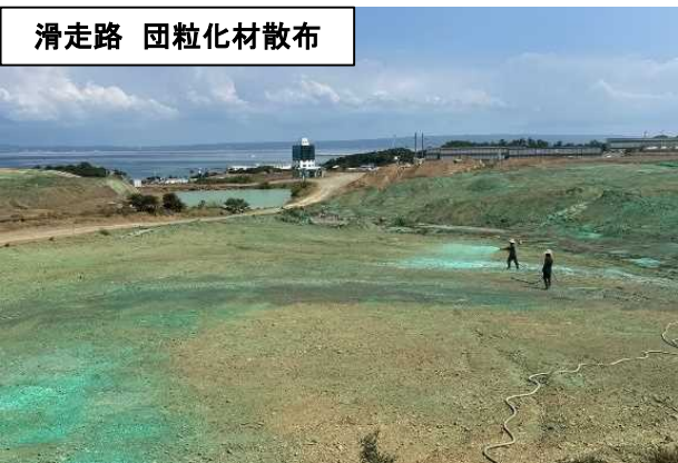
滑走路 団粒化材散布