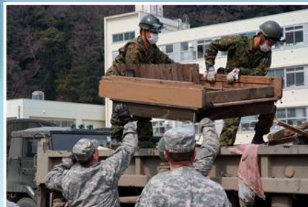
自衛隊と米軍による災害救援活動