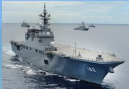
多国間共同訓練(海自と米海軍の艦艇)