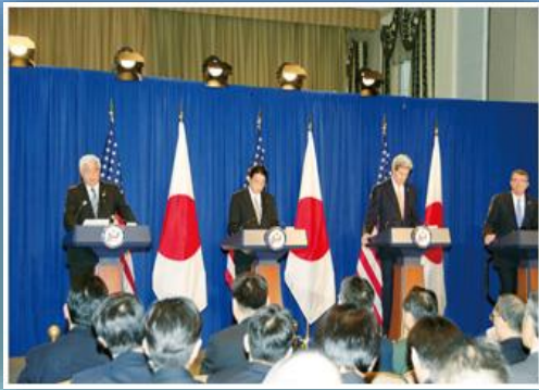
日米安全保障協議委員会(平成27年4月27日)