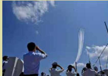
自衛隊フェスタ50・70 in 滋賀高島 (ブルーインパルス飛行展示)