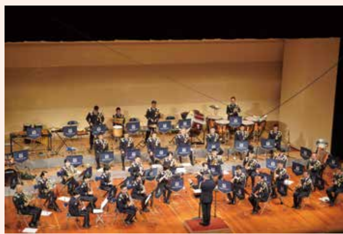
中部方面音楽隊による音楽祭