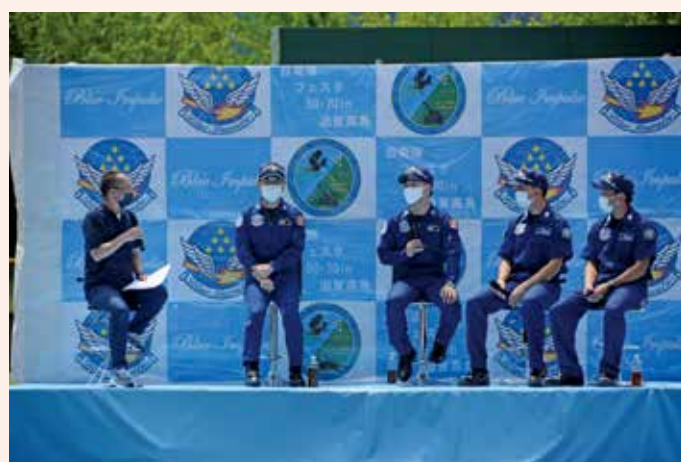
サイン会・トークショー