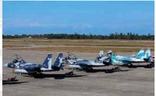
小松基地に駐機する飛行教導群

✈ 小松防衛事務所は、金沢市に所在していた金沢防衛事務所を平成30年1月に小松空港ターミナルビルに隣接する現在の庁舎に移転し、富山県、石川県及び福井県の北陸3県の管轄区域における近畿中部防衛局本局が行う業務全般の連絡及び交渉、調査並びに資料の収集整理などの業務を行っています。