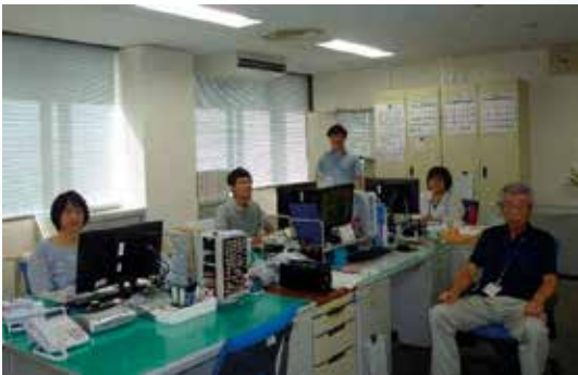
当事務所の執務室です 5名の職員がお待ちしています

✈ 主な業務としては、住宅防音工事や移転措置事業に関する地域住民の皆様からの相談を対面及び電話で対応しています。そのほか、移転措置事業で買い上げた土地（周辺財産）の有償使用許可に関する相談、周辺財産の巡回確認、近畿中部防衛局本局の業務支援などの業務を積極的に行っています。