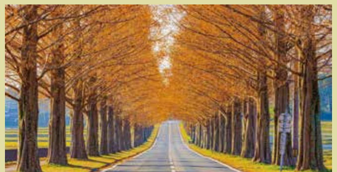
メタセコイヤ並木