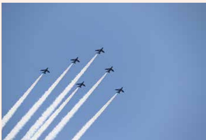
ブルーインパルスの展示飛行

当日は、推計で約11万人の方が来場され、予定していました全てのイベントが無事終了し、大盛況のうちに幕を閉じました。