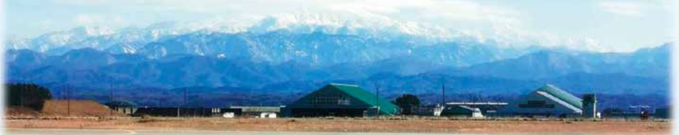
執務室の窓から見た小松飛行場。天气の良い日は、霊峰白山も望めます

✈ 管轄区域の各部隊並びに関係自治体等、地元と緊密に連携し、地域に密着した業務に取り組んでいます。