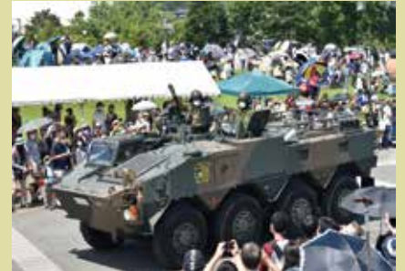
自衛隊フェスタ50・70 in 滋賀高島 (車両パレード)