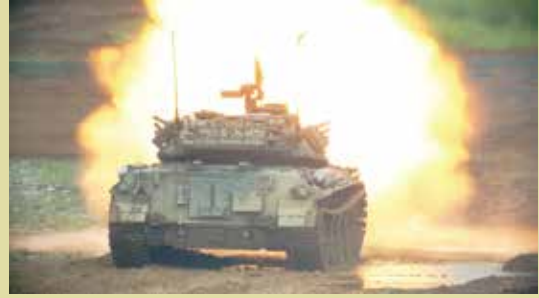
方面戦車射撃競技会