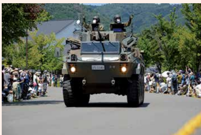
今津総合運動公園での車両パレード