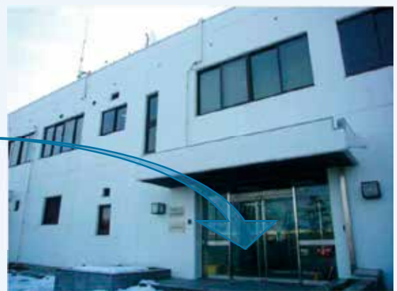
この庁舎の一階です。来所の際は、インターホンで呼び出してください。

【所在地・連絡先】 〒923-0993 石川県小松市浮柳町ヨ21（小松空港庁舎1階） ☎：0761-24-1690 FAX：0761-24-1640