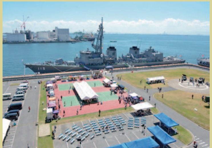
地域との交流 サマーフェスタ