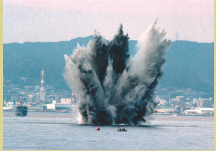
爆発性危険物の爆破処理