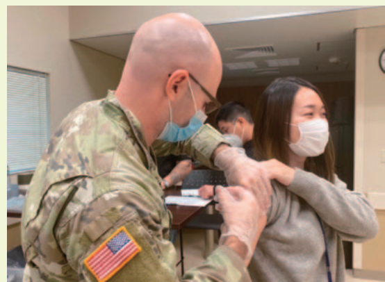
新型コロナウイルスワクチン追加接種の様子