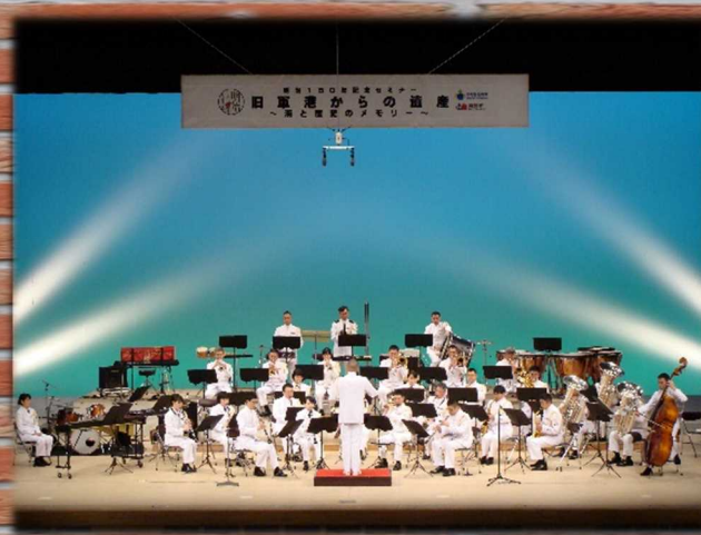
海上自衛隊 舞鶴音楽隊