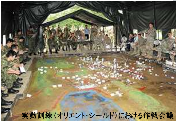
実動訓練(オリエント・シールド)における作戦会議