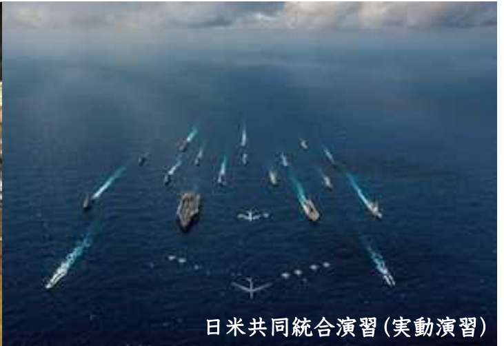
日米共同統合演習(実動演習)