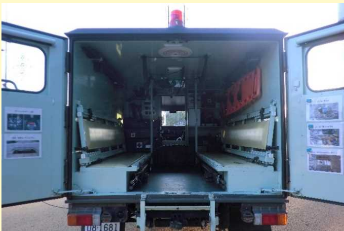
陸上自衛隊が所有する1トン半救急車の展示②