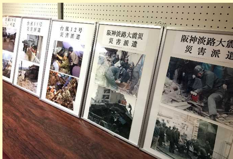
災害派遣活動のパネル展示