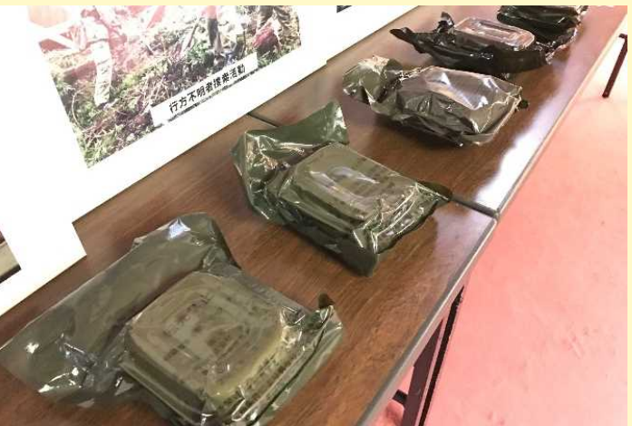
災害時に自衛隊の隊員が携行する食糧(糧食)の展示