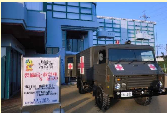
陸上自衛隊が所有する1トン半救急車の展示①