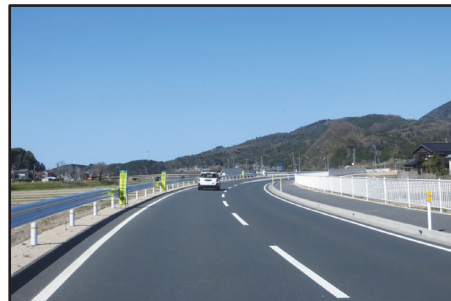
間人大宮線（大門橋）