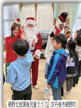
網野北放課後児童クラブ (京丹後市網野町)