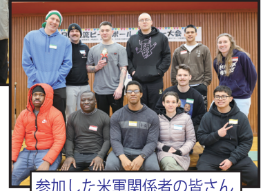
参加した米軍関係者の皆さん