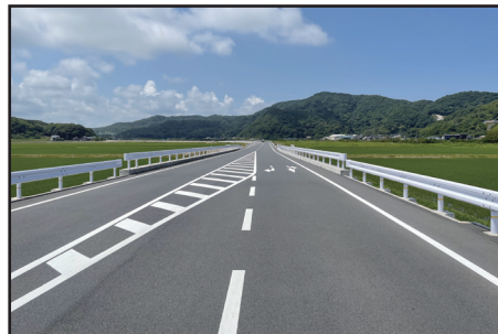
浜丹後線（宮バイパス）