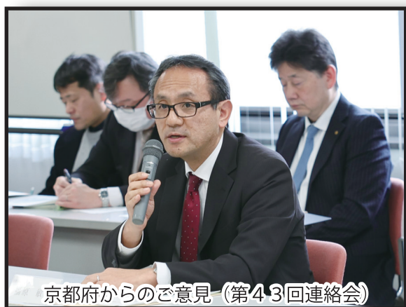
京都府からのご意見（第43回連絡会）