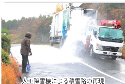
人工降雪機による積雪路の再現