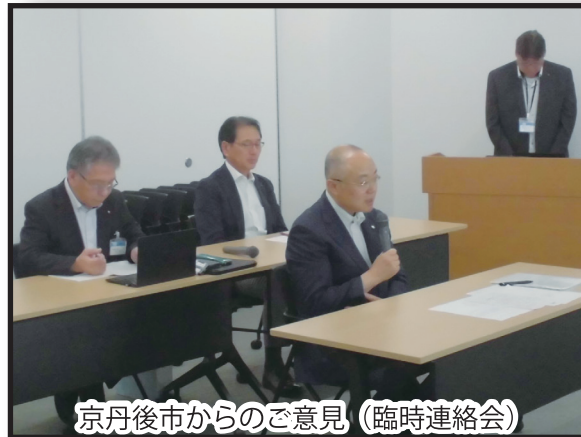
京丹後市からのご意見（臨時連絡会）

また、令和8年1月8日（木）、第43回となる米軍経ヶ岬通信所の設置に係る安全・安心対策連絡会を京丹後市役所（丹後庁舎）において開催しました。