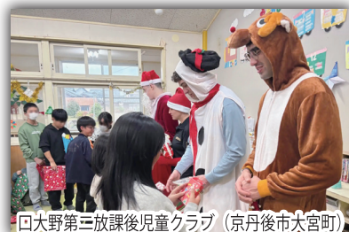
口大野第三放課後児童クラブ (京丹後市大宮町)