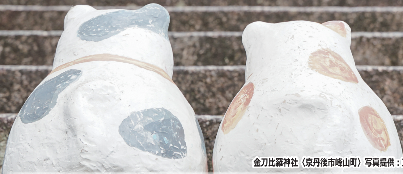
金刀比羅神社（京丹後市峰山町）