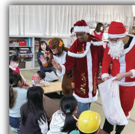
長岡放課後児童クラブ (京丹後市峰山町)