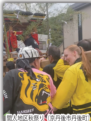
間人地区秋祭り (京丹後市丹後町)