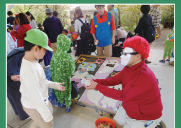
近畿中部防衛局のブース