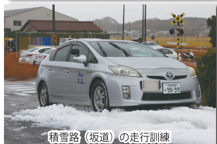
積雪路（坂道）の走行訓練