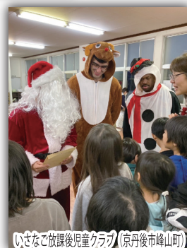
いさなで放課後児童クラブ (京丹後市峰山町)