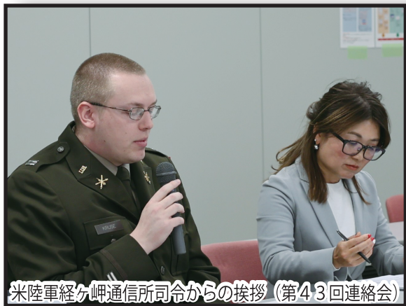
米陸軍経ヶ岬通信所司令から挨拶（第43回連絡会）

この連絡会では、経ヶ岬通信所における状況、昨年12月に実施した人工降雪機を使用した交通安全講習会、水質調査の実施のお知らせ、最近の事案、ハロウィンイベントなどの日米交流事業、まちづくりへの支援などについて、京都府や京丹後市、地域住民代表の方々にご説明を行いました。