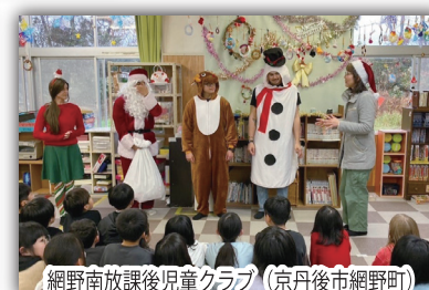
網野南放課後児童クラブ (京丹後市網野町)