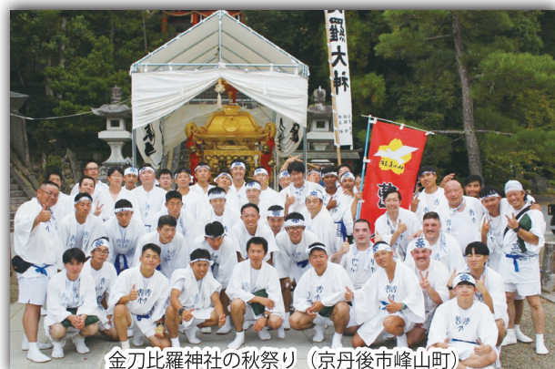
金刀比羅神社の秋祭り (京丹後市峰山町)