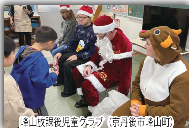
峰山放課後児童クラブ (京丹後市峰山町)