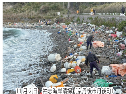
11月2日 袖志海岸清掃 (京丹後市丹後町)