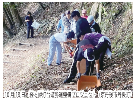
10月18日 経ヶ岬灯台遊歩道整備プロジェクト (京丹後市丹後町)