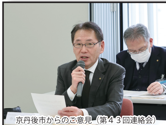
京丹後市からのご意見（第43回連絡会）