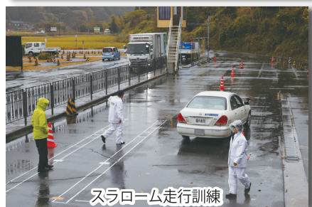
スラローム走行訓練