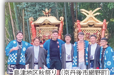
島津地区秋祭り (京丹後市網野町)