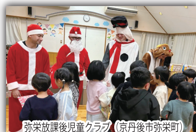
弥栄放課後児童クラブ (京丹後市弥栄町)