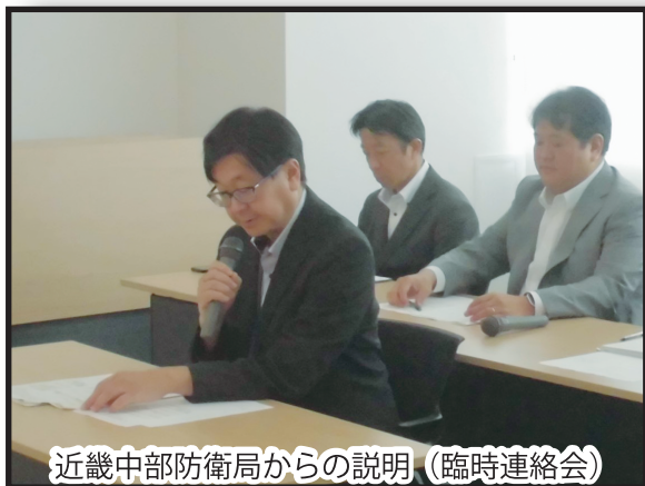
近畿中部防衛局からの説明（臨時連絡会）

この連絡会では、第42回米軍経ヶ岬通信所の設置に係る安全・安心対策連絡会（令和7年7月31日（木）実施）において、京丹後市よりご質問いただきました地元への事前の情報提供が行われなかった日米共同基地警備訓練につきまして、事案の発生原因及び再発防止に向けた取り組みを京都府や京丹後市、地域住民代表の方々にご説明を行いました。