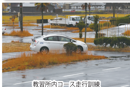
教習所内コース走行訓練