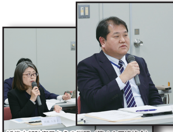
近畿中部防衛局からの説明（第43回連絡会）