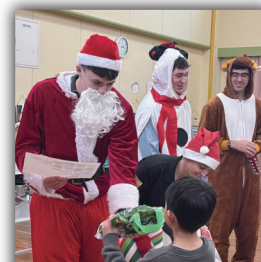
口大野第一放課後児童クラブ (京丹後市大宮町)