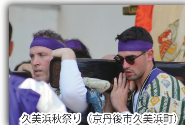
久美浜秋祭り (京丹後市久美浜町)