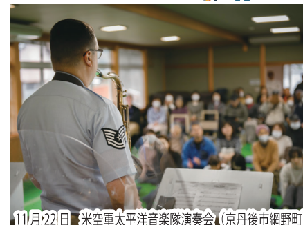
11月22日 米空軍太平洋音楽隊演奏会 (京丹後市網野町)