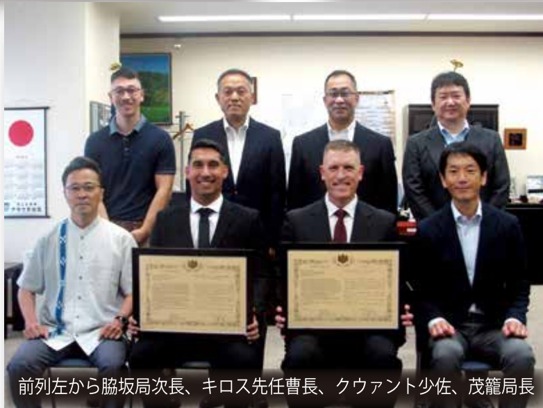
前列左から脇坂局次長、キロス先任曹長、クワント少佐、茂籠局長