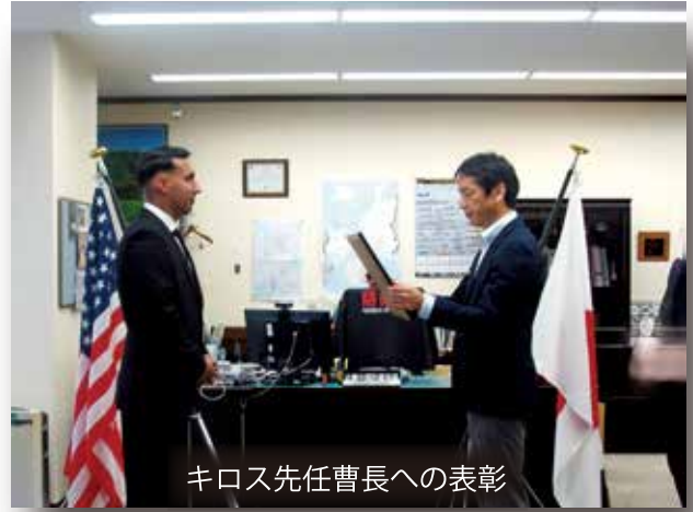
キロス先任曹長への表彰