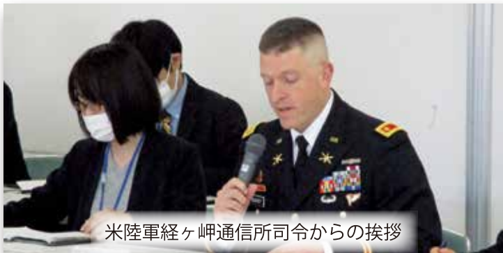
米陸軍経ヶ岬通信所司令からの挨拶