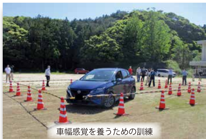
車幅感覚を養うための訓練