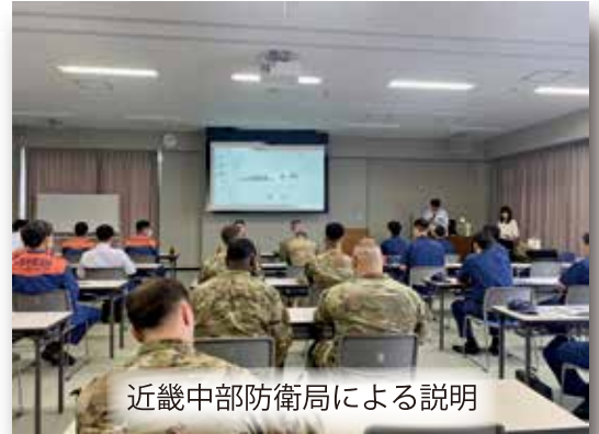
近畿中部防衛局による説明