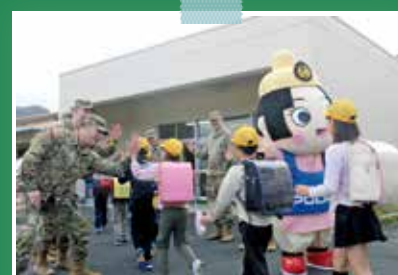
4月16日京丹後市立宇川小学校(京丹後市丹後町)