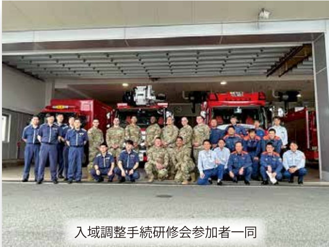
入域調整手続研修会参加者一同

その後、入域調整訓練として、米軍関係者は出席された消防機関と入域調整手続きの実習を実施しました。参加者は、関係機関との意見交換をしながら、真剣に訓練に取り組んでいました。