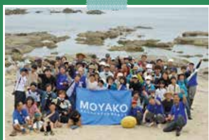
5月19日 水晶浜(京丹後市網野町)