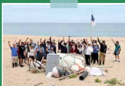
6月15日 箱石浜(京丹後市久美浜町)