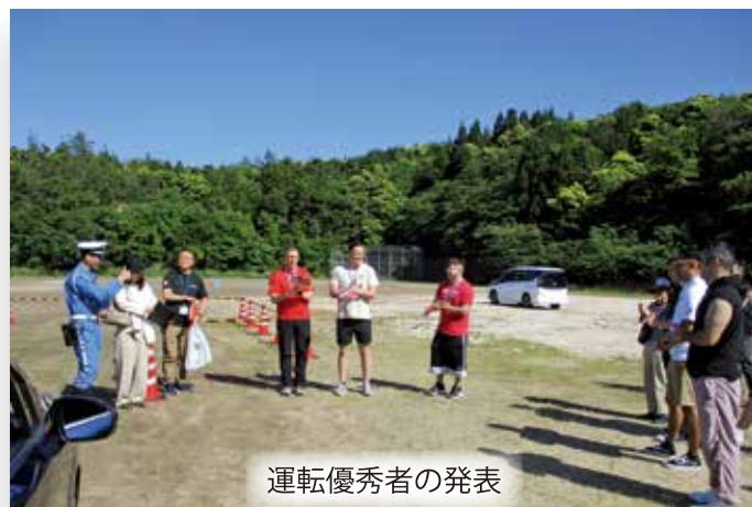
運転優秀者の発表