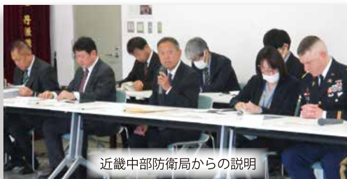
近畿中部防衛局からの説明