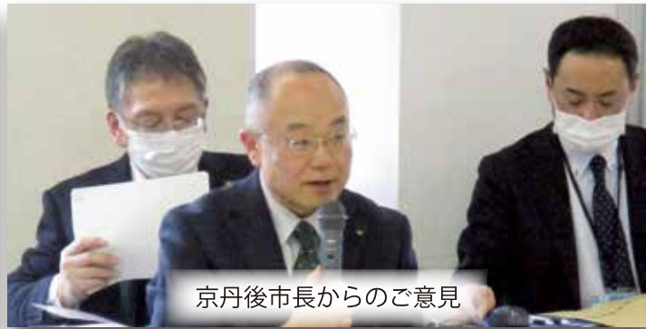
京丹後市長からのご意見