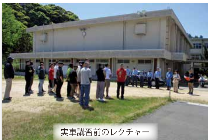
実車講習前のレクチャー