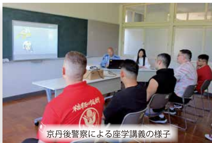
京丹後警察による座学講義の様子