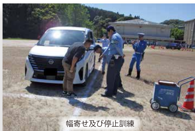
幅寄せ及び停止訓練