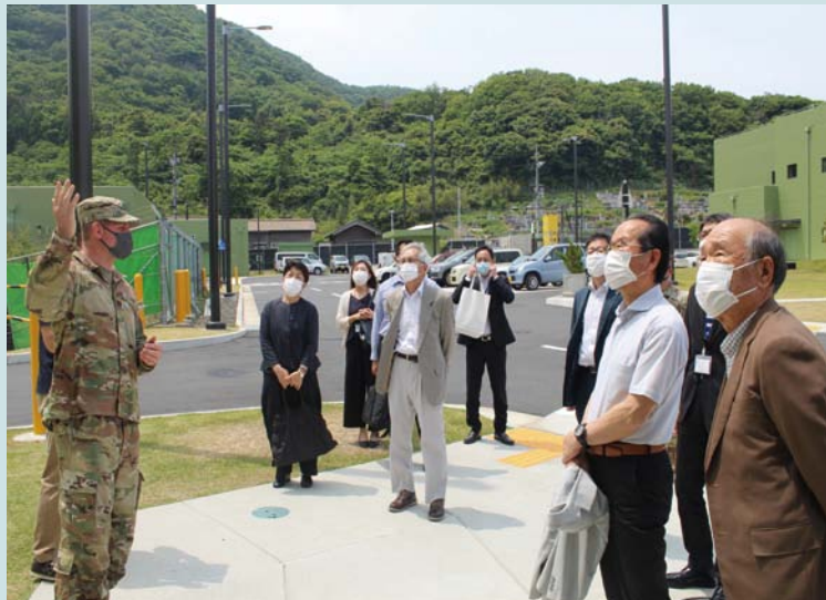
生活関連施設見学会の様子