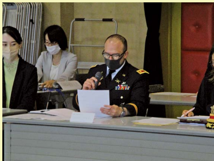
米軍経ヶ岬通信所司令官からの挨拶