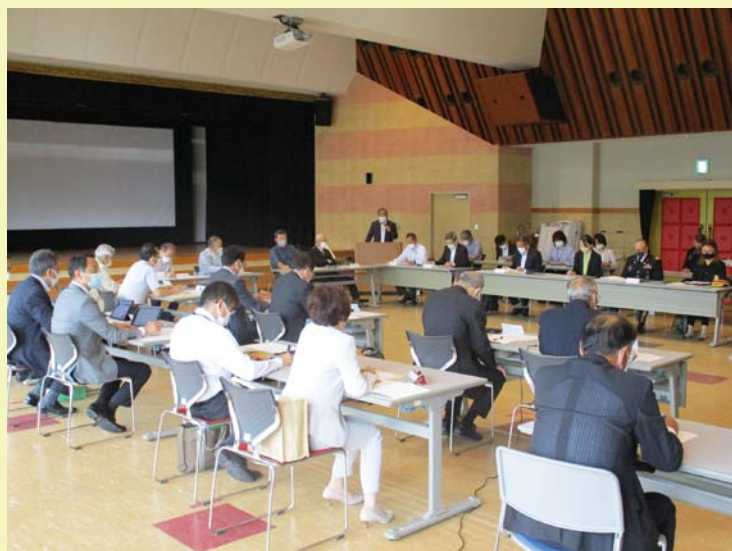
第31回安全・安心対策連絡会の開催