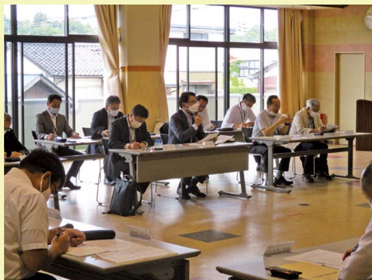
京丹後市副市長からのご意見