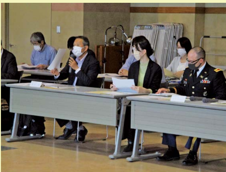
近畿中部防衛局からの説明