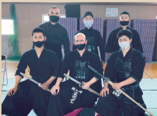
陸自第7普通科連隊剣道クラブメンバー