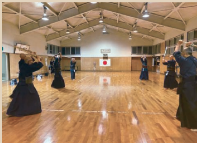
地元の剣道師範との練習