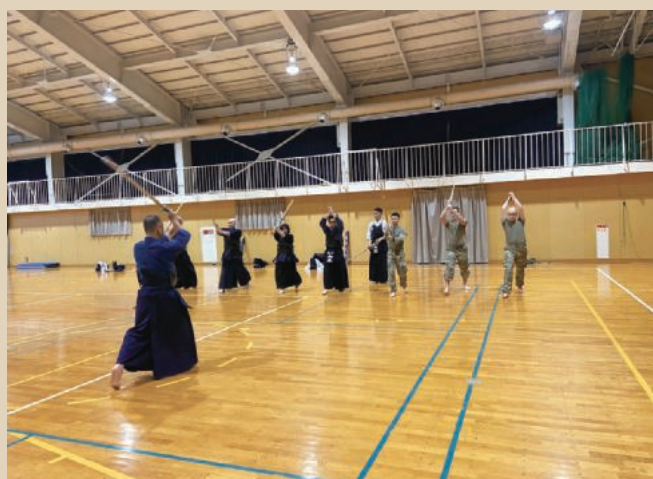
空自経ヶ岬分屯基地での練習