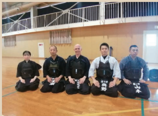
空自第35警戒隊剣道クラブメンバー