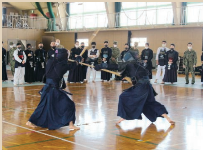
陸自福知山駐屯地での異種格闘（剣道対銃剣道）