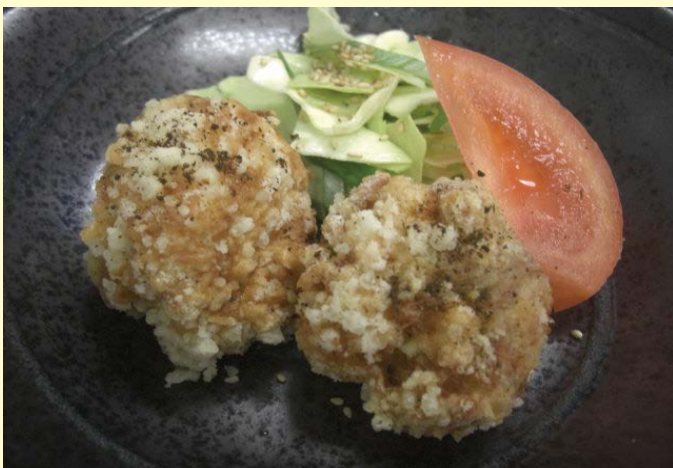
空自空上げ受賞作品「七味鶏」

（「七味鶏」のレシピは航空自衛隊HP スペシャルコンテンツ「空自空上げ」で掲載されています。）