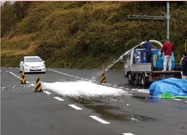
人工降雪機による積雪路の再現