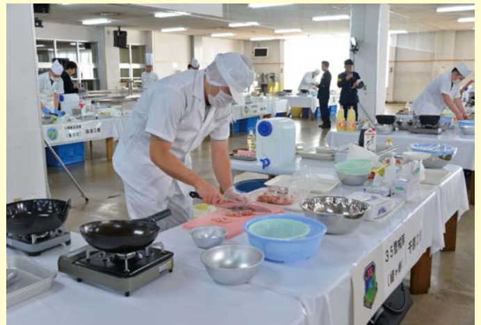
調理競技会の様子