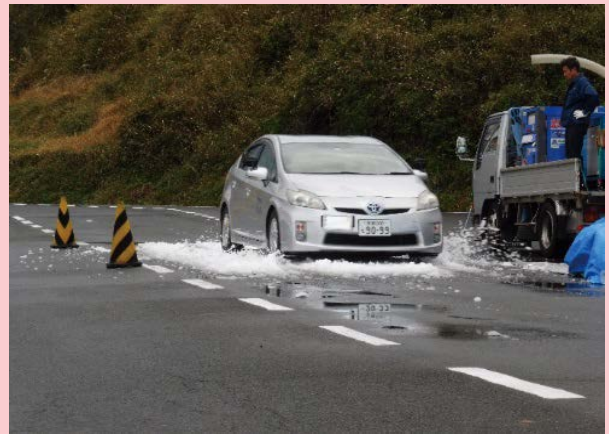
積雪路面におけるスリップ体験等