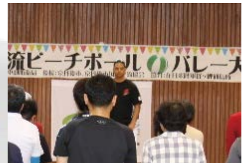
米陸軍経ヶ岬通信所 ブガド前中隊長