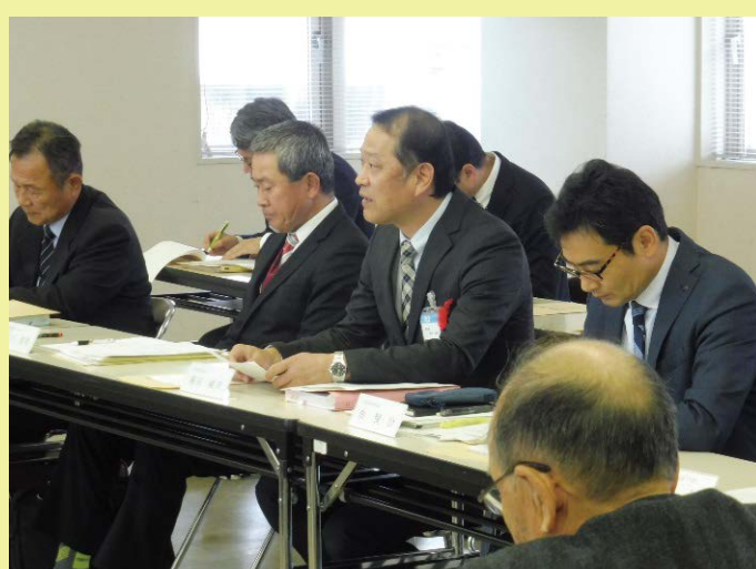
構成員の方々からのご意見