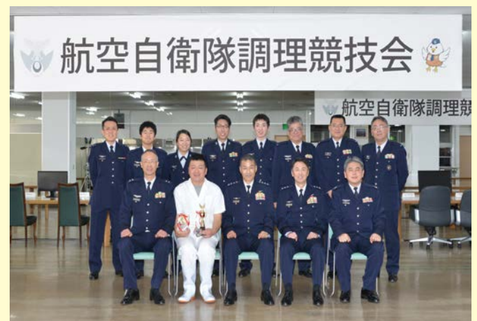
金賞及び航空幕僚長特別賞を受賞