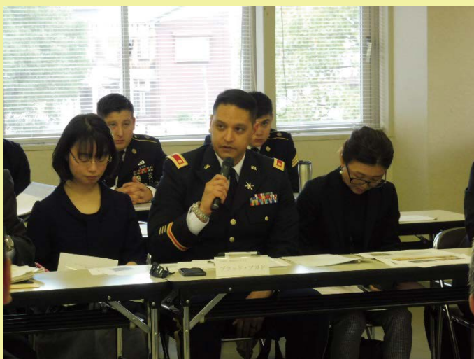
第14ミサイル防衛中隊長からの挨拶