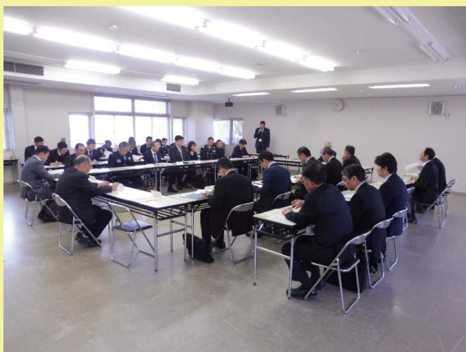
第22回安全・安心連絡会の開催

また、前回の連絡会で、構成員の方から、本連絡会の在り方、進め方について一度検証してもらいたいとのご意見があったことを踏まえ、当局としては、今後の連絡会における議論の活性化を図ることができるよう、説明事項・資料構成の改善や通信所の現地見学を組み入れる等、何らかの新しい企画を取り入れるように努めたい旨をご説明しました。