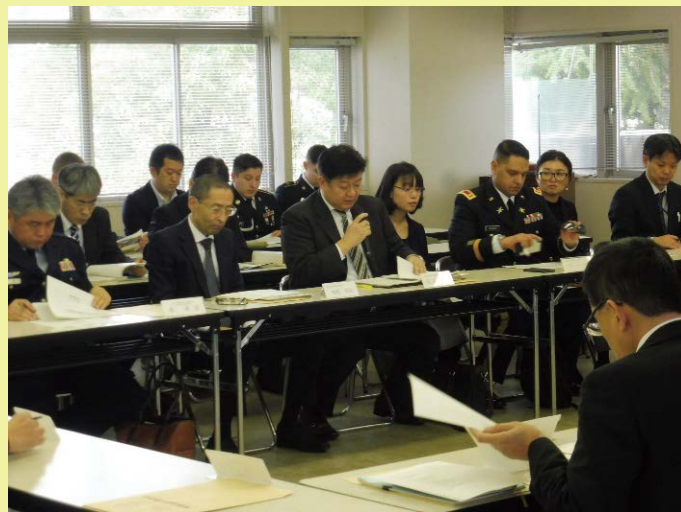
近畿中部防衛局からの説明