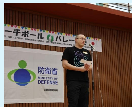
在日米陸軍経ヶ岬通信所 ジョシュア・クルーズ司令官