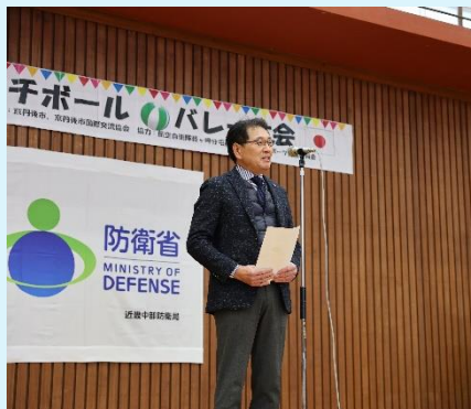
京丹後市 中西副市長