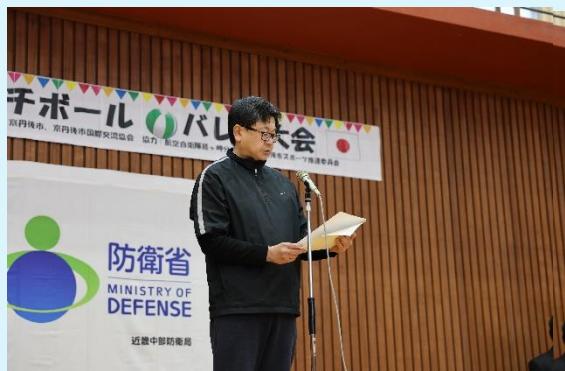
近畿中部防衛局 丸山局長