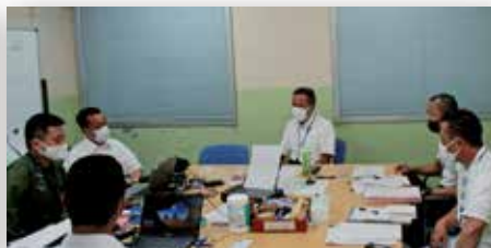
現地対策本部における調整