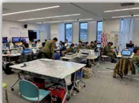
輪島市役所内の合同調整所

派遣された職員は、石川県災害対策本部員会議や輪島市災害対策本部会議などに出席し、現地での自治体や官公庁等関係機関の活動状況等の情報収集及び米軍支援に関する自治体等への連絡調整を実施しました。