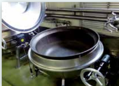
交付金事業（給食調理設備整備）