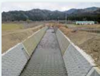
障害防止事業（河川改修）