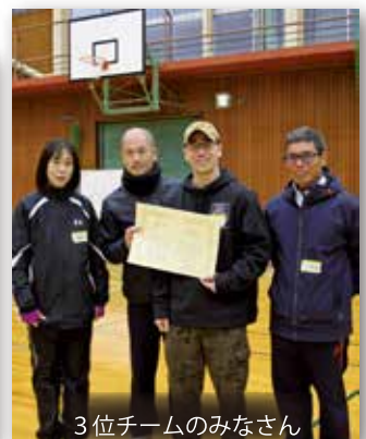
3位チームのみなさん