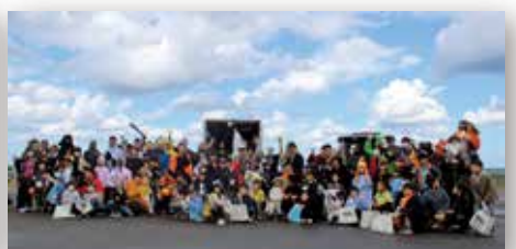
日米交流イベント