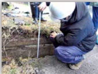
埋設管の被災状況の確認

1月2日（火）、地元の方々が避難所として使用されている輪島分屯基地の応急危険度判定を行うため、局施設整備調査チーム（局調達部職員8名で編成）を現地へ派遣し、3日（水）～5日（金）にかけて、本省職員とともに現地調査を実施しました。