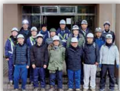
帰局前の集合写真

また、輪島分屯基地の山頂地区へのアクセスが可能となったことから、2月5日（月）～7日（水）の間に、再び同調査チーム（局調達部職員8名）を現地へ派遣し、6日（火）に同地区の現地調査を行いました。