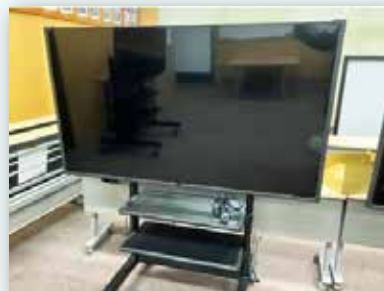
交付金事業（学校教育機器整備）