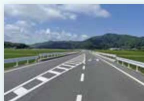
民生安定事業 （道路改修）