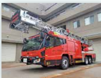
民生安定事業 （はしご付き消防ポンプ自動車）