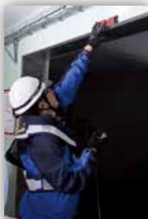
施設の水平度確認

また、輪島分屯基地の山頂地区へのアクセスが可能となったことから、2月5日（月）～7日（水）の間に、再び同調査チーム（局調達部職員8名）を現地へ派遣し、6日（火）に同地区の現地調査を行いました。