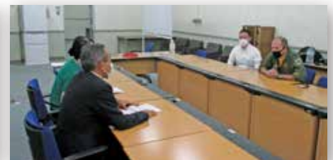
米軍への安全要請