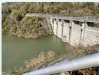
障害防止事業（治水ダム）