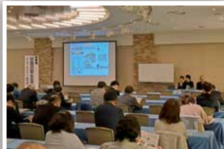
日本保育協会（令和5年12月11日）