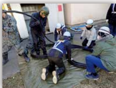
ケーブルの応急復旧支援

現地では、自衛隊施設が災害復旧の活動拠点又は住民の避難場所としての使用を目的に被害状況の確認及び技術支援等を実施しました。