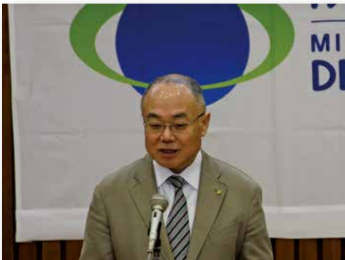
京丹後市 中山泰市長の挨拶