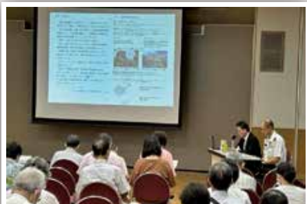
緑JOY大学（令和5年9月22日）

ご興味がある方は、近畿中部防衛局企画部地方調整課地方協力確保室（Tel: 06-6945-4956）までご連絡ください。