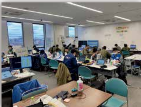
輪島市役所内の合同調整所