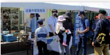
広報ブースの設置