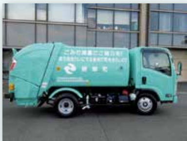
交付金事業（ごみ収集車）