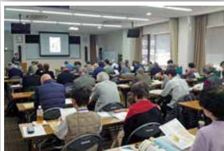
大阪府高齢者大学（令和5年11月22日）