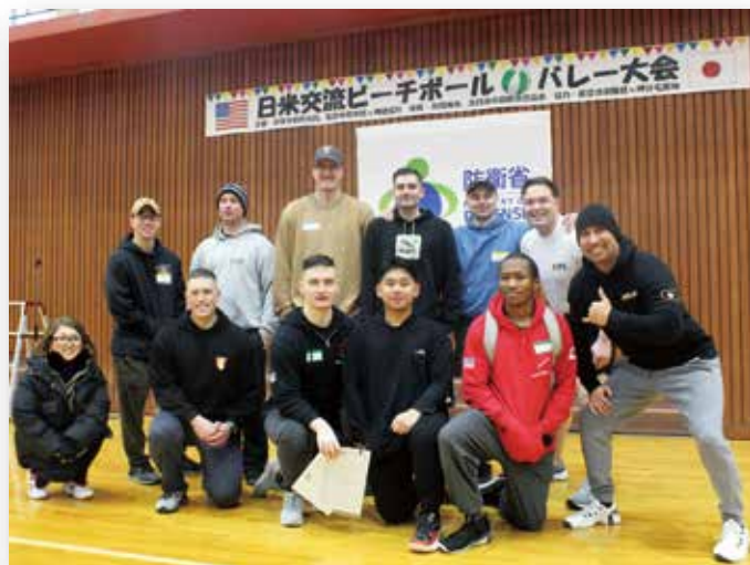
参加した米陸軍経ヶ岬通信所のメンバー