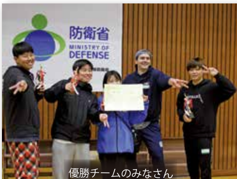
優勝チームのみなさん