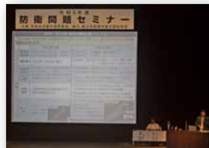
防衛問題セミナーの開催