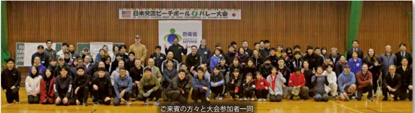
ご来賓の方々と大会参加者一同