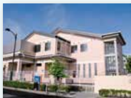
民生安定事業 （防災食育センター）