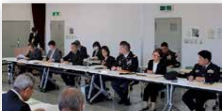
地元自治体や地域住民代表等との連絡会