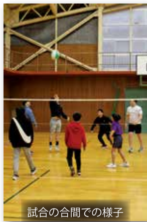
試合の合間での様子