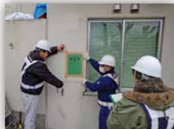
建物の応急危険度の判定

現地では、自衛隊施設が災害復旧の活動拠点又は住民の避難場所としての使用を目的に被害状況の確認及び技術支援等を実施しました。