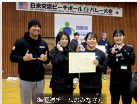
準優勝チームのみなさん