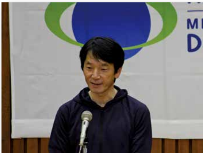
(主催) 近畿中部防衛局 茂籠勇人局長の挨拶