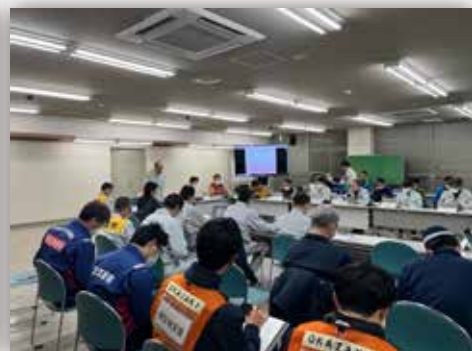
輪島市災害対策本部会議