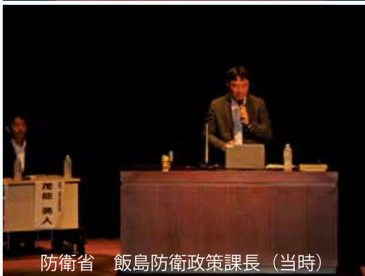
防衛省 飯島防衛政策課長 (当時)