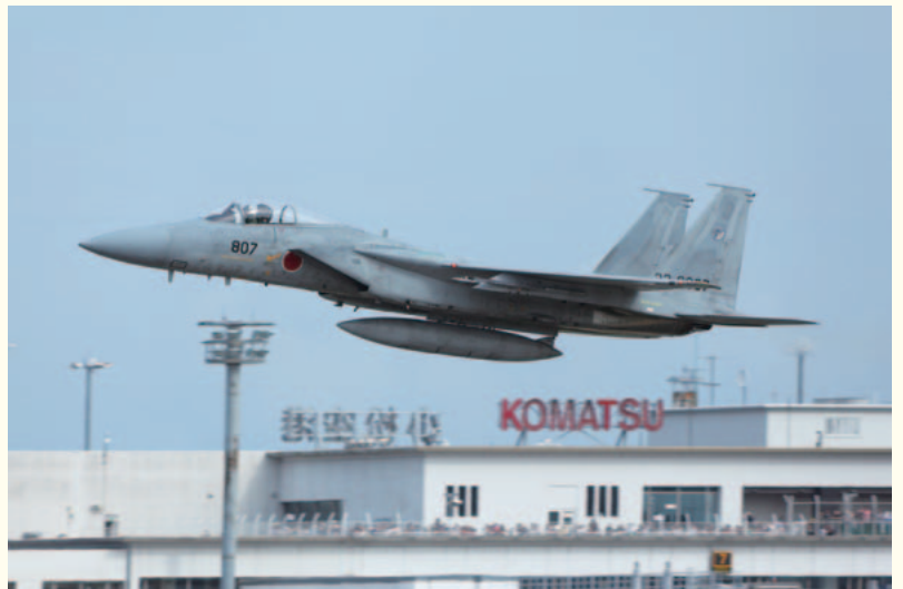
（民間航空会社と自衛隊が共同使用する小松空港は航空機ファンに人気のスポット）

さらに、国から「SDGs未来都市」に選定され、地球に貢献できるひとづくり・まちづくりを推進し、計画的に取り組みを進めています。2024年春には北陸新幹線が小松にやってまいります。