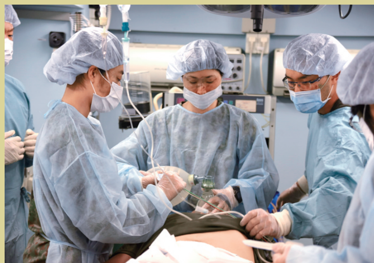
野外手術車（大型車両内）での訓練