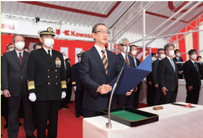
自衛艦命名式（「はくげい」と命名）

「はくげい」は、今後、艦内ぎ装工事、海上公試を経て、令和5年3月頃に海上自衛隊へ引き渡される予定となっており、契約の適正な履行を確保するために、近畿中部防衛局調達部装備課の職員が監督及び検査業務に従事しているところです。