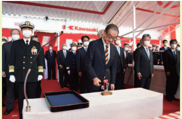
島田和久防衛事務次官による支綱切断