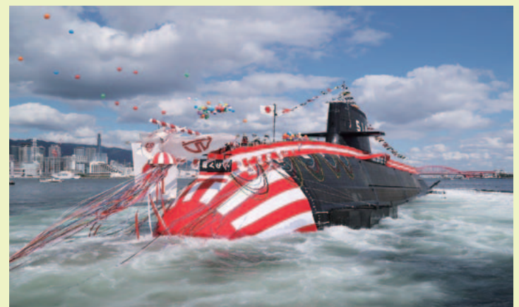
進水する「はくげい」