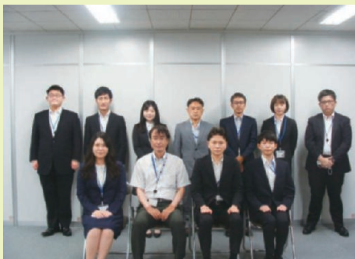
総務部長、総務課長と研修生

研修後の所感文では、「局内のみならず各機関や地方自治体等との業務の繋がりについて理解が深まり、近畿中部防衛局の全体像が認識できた」や、「研修員同士コミュニケーションを図ることにより入省同期との絆を深めることができた」などの意見が寄せられました。