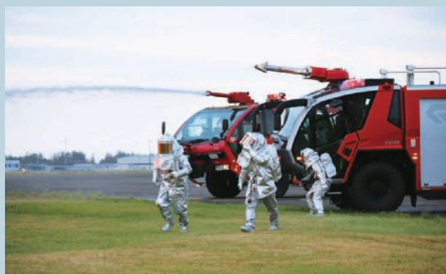
消防小隊による消火訓練