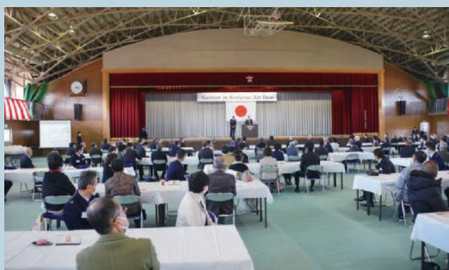
ガブフェスト イン小松

小松基地は、地域住民との親睦を深め、自衛隊の活動の理解と協力を得るべく、あらゆる機会を活用して地域との交流を進めています。