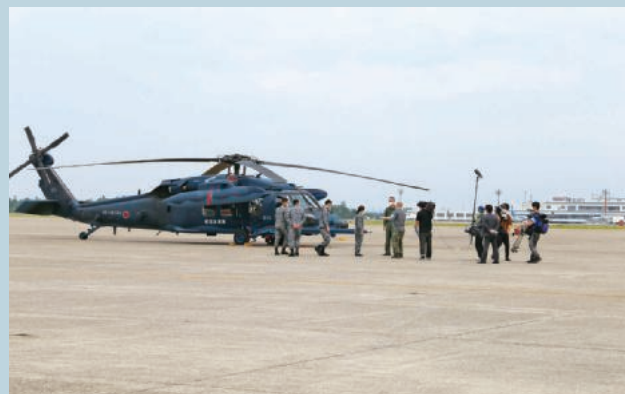
取材への協力 (小松救難隊)