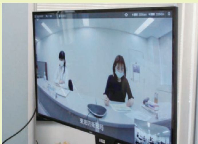
テレビ会議システムによる研修