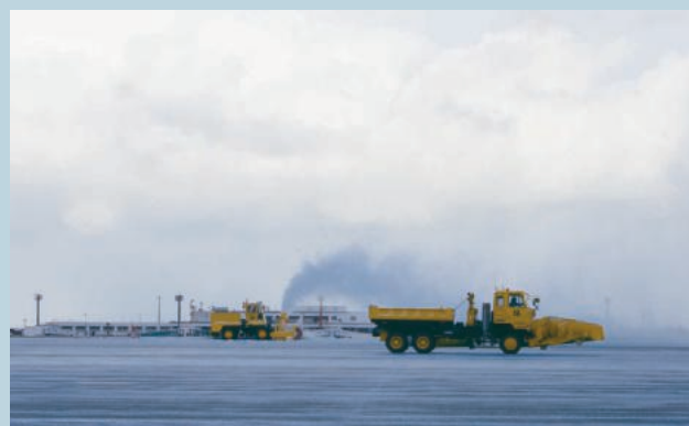
施設隊による除雪作業