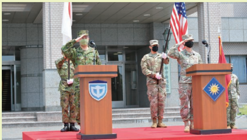
伊丹駐屯地での訓練開始式

当局としては、今後とも、自衛隊及び在日米軍の各種活動が円滑に実施できるよう、関係自治体及び住民の皆様の理解と協力を得るための取り組みを続けて参ります。