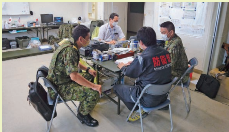
饗庭野演習場内に設置した 現地連絡本部における調整