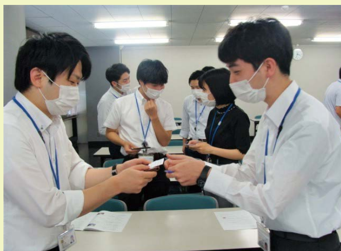
ビジネスマナー講習の様子