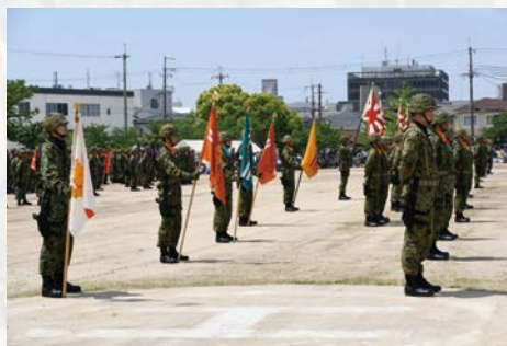
師団創立記念行事 (観閲式：第 3 師団隷下部隊)