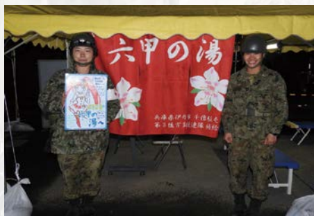
令和元年度台風 1 9 号に伴う災害派遣 (入浴支援)