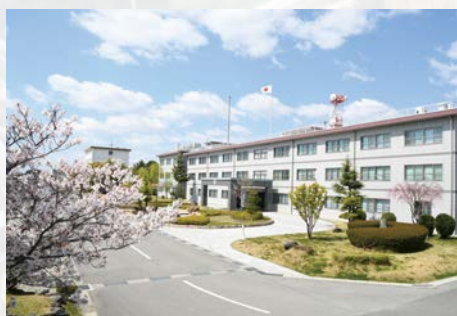
第 3 師団司令部庁舎