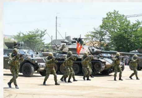
師団創立記念行事 (訓練展示：戦闘職種部隊)