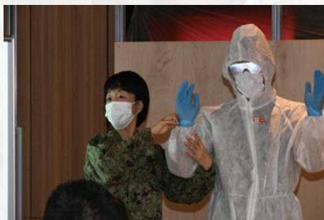
新型コロナウイルス市中感染拡大防止に伴う災害派遣 (教育支援)

第 3 師団は、防衛・警備等の各種事態や災害派遣等に対する即応態勢を維持するとともに、平素における地域との交流等のため、様々なイベントを開催しています。