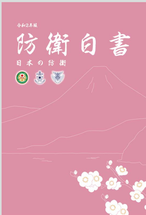
令和2年版防衛白書表紙

表紙のデザインについては、令和という元号が万葉集の梅の花の歌に由来していることから、梅の花と色を用いるとともに、ちょうど50年前に創刊された当時の防衛白書の表紙にも用いられていた富士山と、陸・海・空の3自衛隊のマークを用いることといたしました。