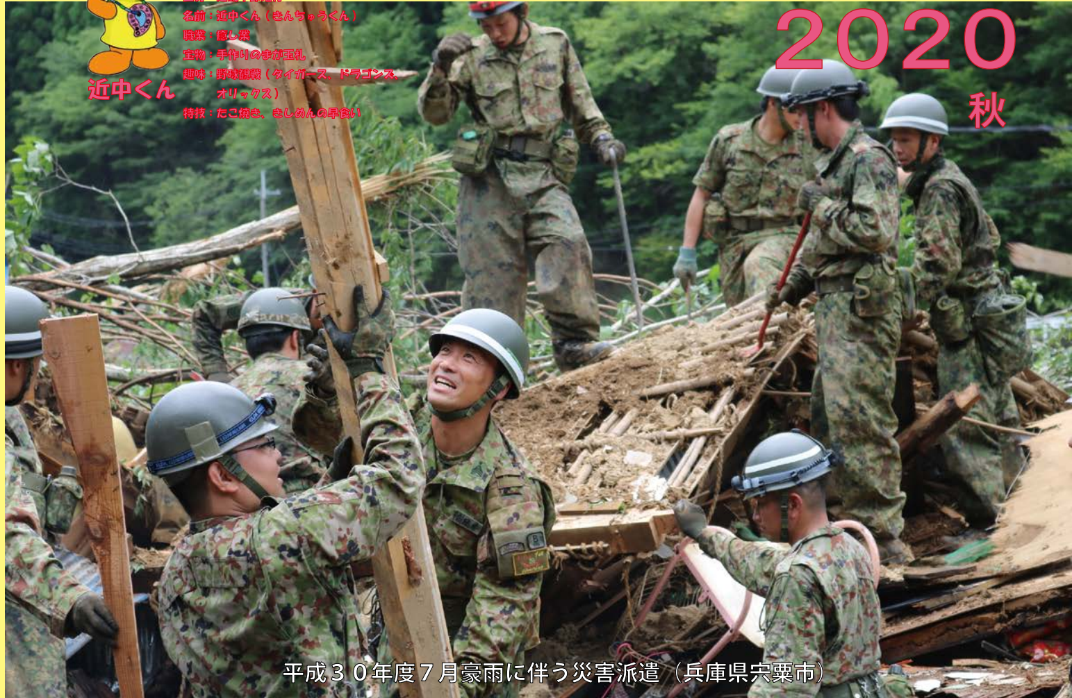
平成30年度7月豪雨に伴う災害派遣（兵庫県宍粟市）