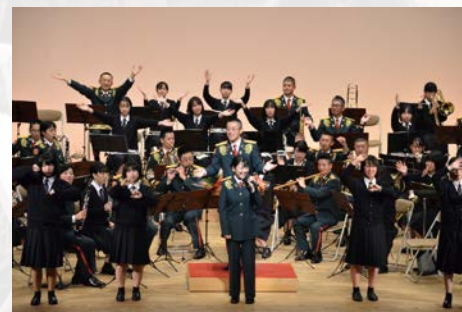
第 3 師団巡回演奏会 (近畿 2 府 4 県で順次開催)