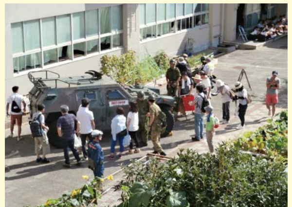
小学校敷地内で行われた地域の市民防災訓練

市民防災訓練時の非常食の炊き出し、災害派遣車両・装備品展示のほか、20万人以上の沿道応援者が集まる「金沢マラソン」における参加者の安全確保等、広くご協力をいただいております。今後も自衛隊の皆さんとの連携・協力を図りながら、実効性のある災害への備えを進め、「安心・安全のまち」の実現のため、取り組んでまいりたいと考えています。