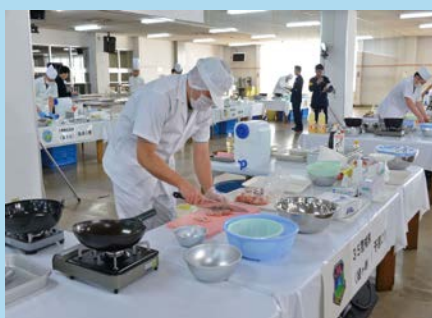
調理競技会の様子