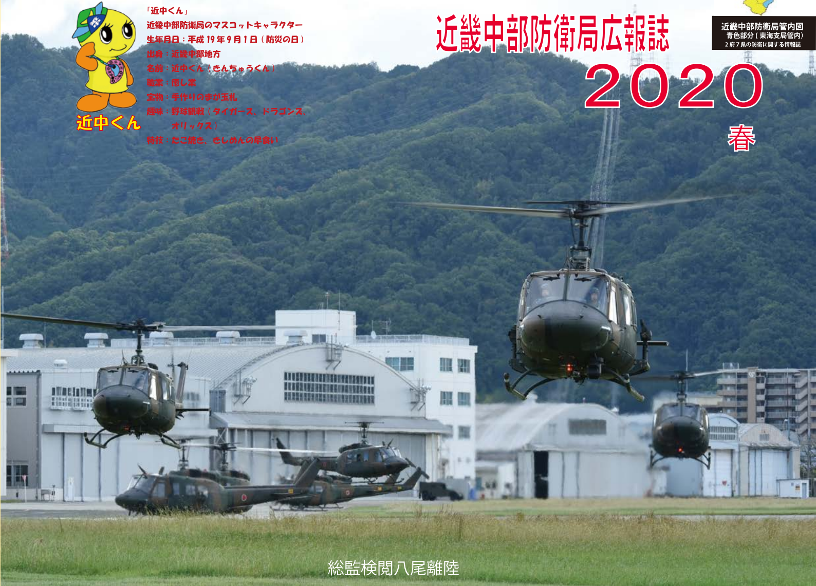
総監検閲八尾離陸