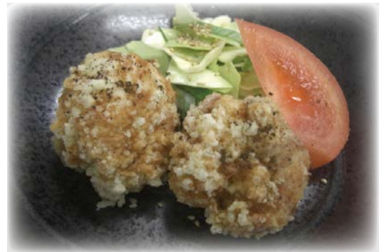
空自空上げ受賞作品「七味鶏」

(「七味鶏」のレシピは航空自衛隊HPスペシャルコンテンツ「空自空上げ」で掲載されています。)