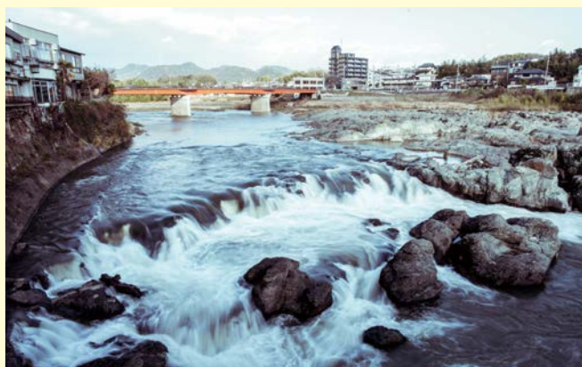
奇、怪岩が成す闘竜灘の激流

また、5月3日には、花まつり鮎まつりが行われ、闘竜灘からの打上花火は、北播磨に初夏の訪れを告げる風物詩となっています。