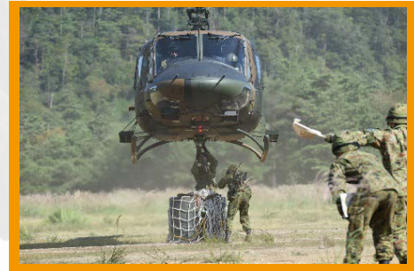
物資輸送（スリング）訓練