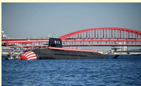
「とうりゅう」の進水