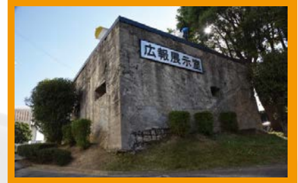
八尾駐屯地広報展示室