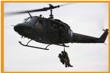
人命救助（ホイスト）訓練