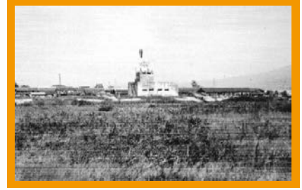
飛行第246戦隊指揮所

旧陸軍飛行第246戦隊が使用していた戦闘指揮所は現存し、今は駐屯地の広報展示室となっています。