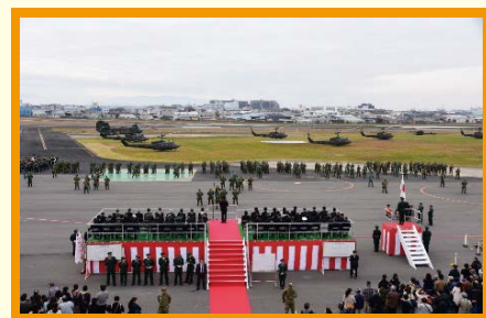
駐屯地創立記念行事