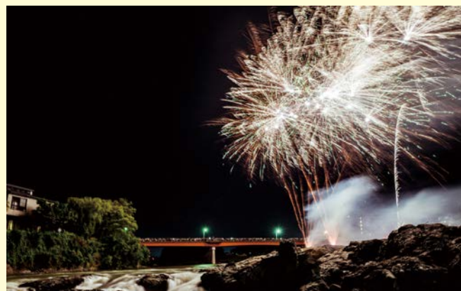
鮎まつりの様子。闘竜灘の美しい景色と、花火が見る人の心を明るく照らします。

昨年11月に進水したそうりゅう型潜水艦の12番艦「とうりゅう」は、この闘竜灘から命名していただき、まちの自慢の名勝に、新たな歴史が加わったことを大変嬉しく思っています。最新鋭艦への命名を心から光栄に存じます。