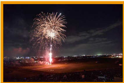
駐屯地盆踊り花火大会

駐屯地は、駐屯地盆踊り花火大会（8月）と駐屯地創立記念行事（10月）の年2回、駐屯地を一般開放し、地域の皆様と交流を図っています。また、近隣地域の自治体等が企画するお祭りや防災関連行事に参加し、装備品や活動パネルを展示しています。