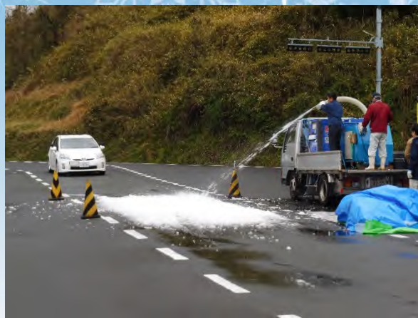
人工降雪機による積雪路の再現