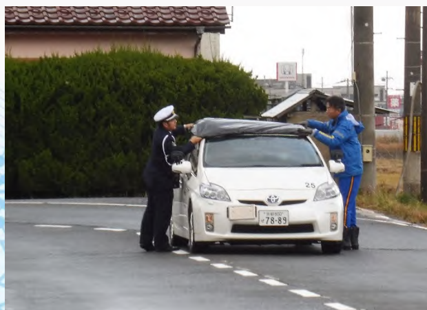
屋根の上の積雪が視界を塞ぐケースの再現