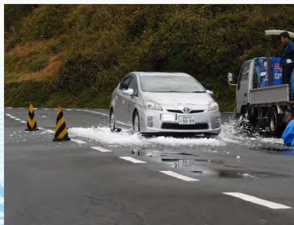
積雪路面におけるスリップ体験等