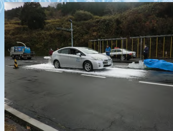
積雪路面上の走行練習