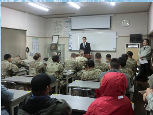
京丹後警察署交通課長の挨拶

今回の講習会では、これから本格的な降雪期を迎えることを踏まえ、特に冬季の運転において注意を要する事項に重点を置いた座学講義や、人工降雪機を使用して再現した積雪路の走行などの実車講習を行いました。