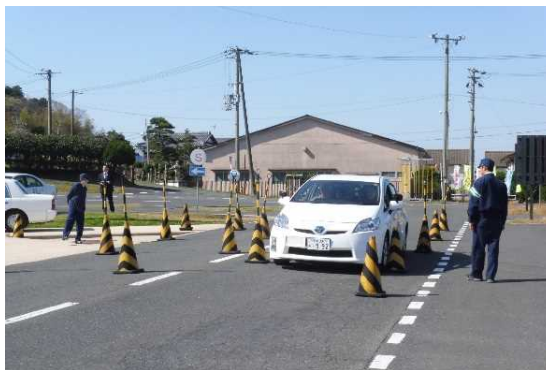
実車講習の様子（峡路の走行）