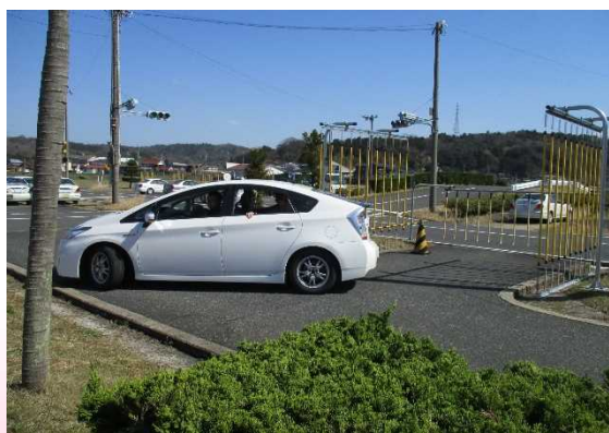
実車講習の様子（駐車）