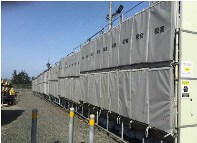
防音パネル等の設置