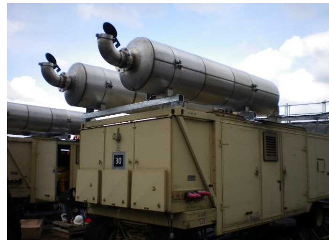
発電機へのマフラー設置