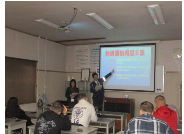
京丹後警察による座学講義