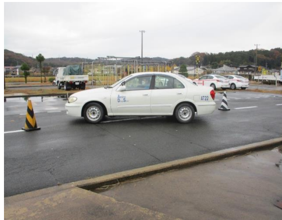
車幅の感覚を磨くパイロンスラローム