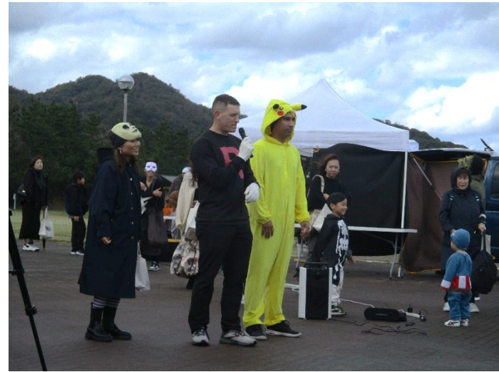
八丁浜シーサイドパーク