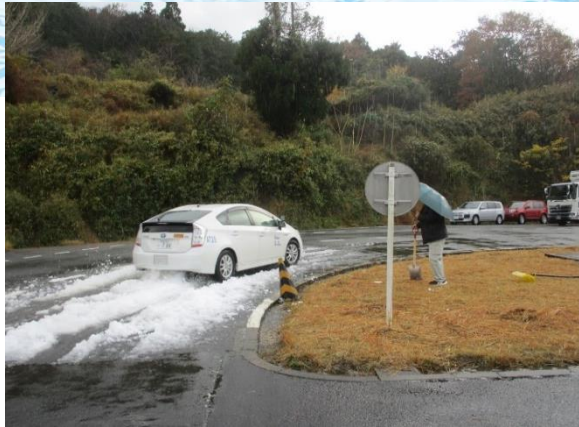
積雪路面におけるコーナリング

今回の講習会では、日本の交通ルール及び冬期の運転において注意する事項を学ぶ座学講義を行いました。また本格的な降雪期を迎えることを踏まえ、人工降雪機を使用して再現した積雪路の走行並びにカラーコーンを用いて車幅の感覚を磨くための実車講習を実施しました。