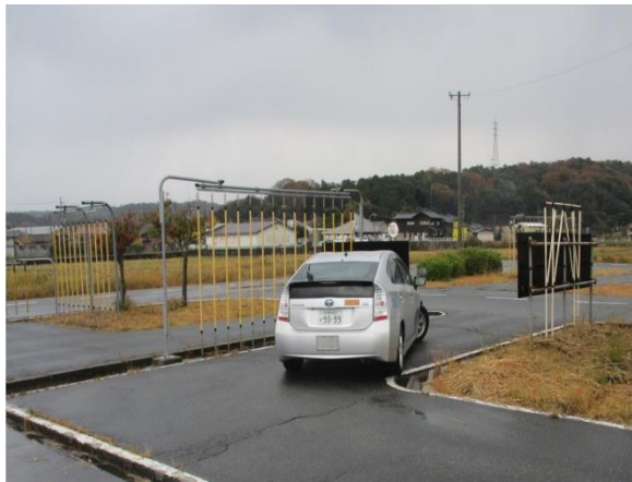
クランクコースの走行