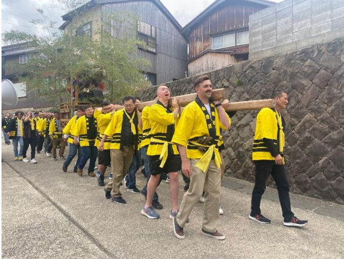
秋祭りへの参加 (2023年10月8日(日))