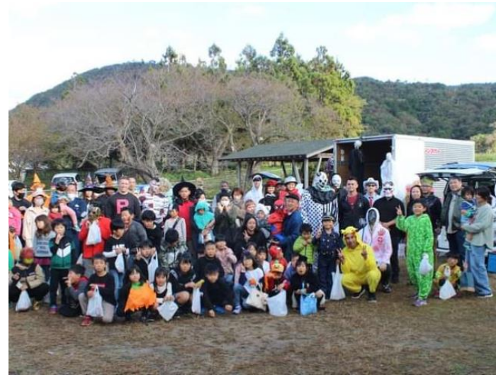
宇川アクティブライフハウス