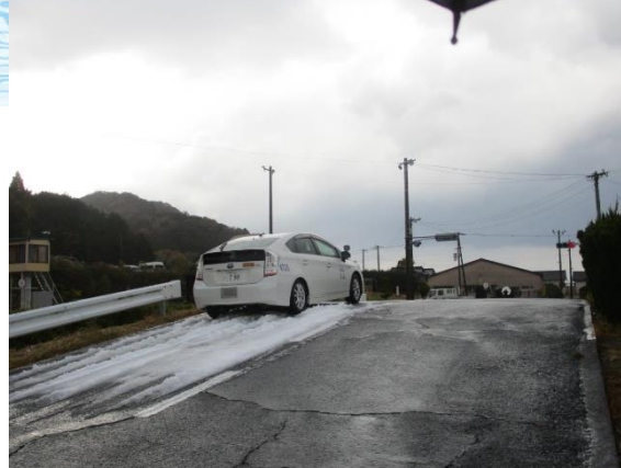
積雪路面における坂道発進