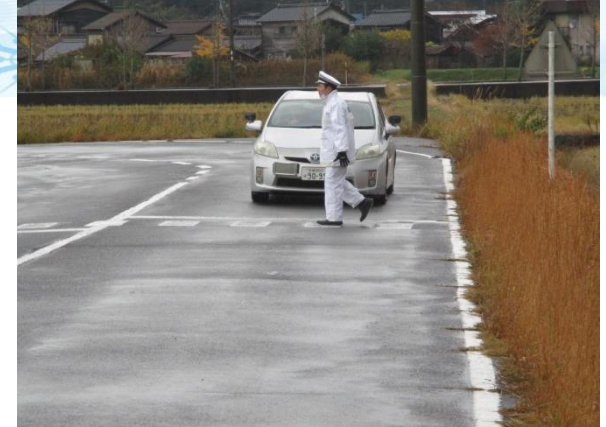
横断歩道の一時停止