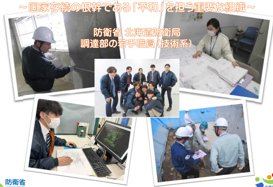
防衛省 北海道防衛局 調達部の若手職員(技術系)