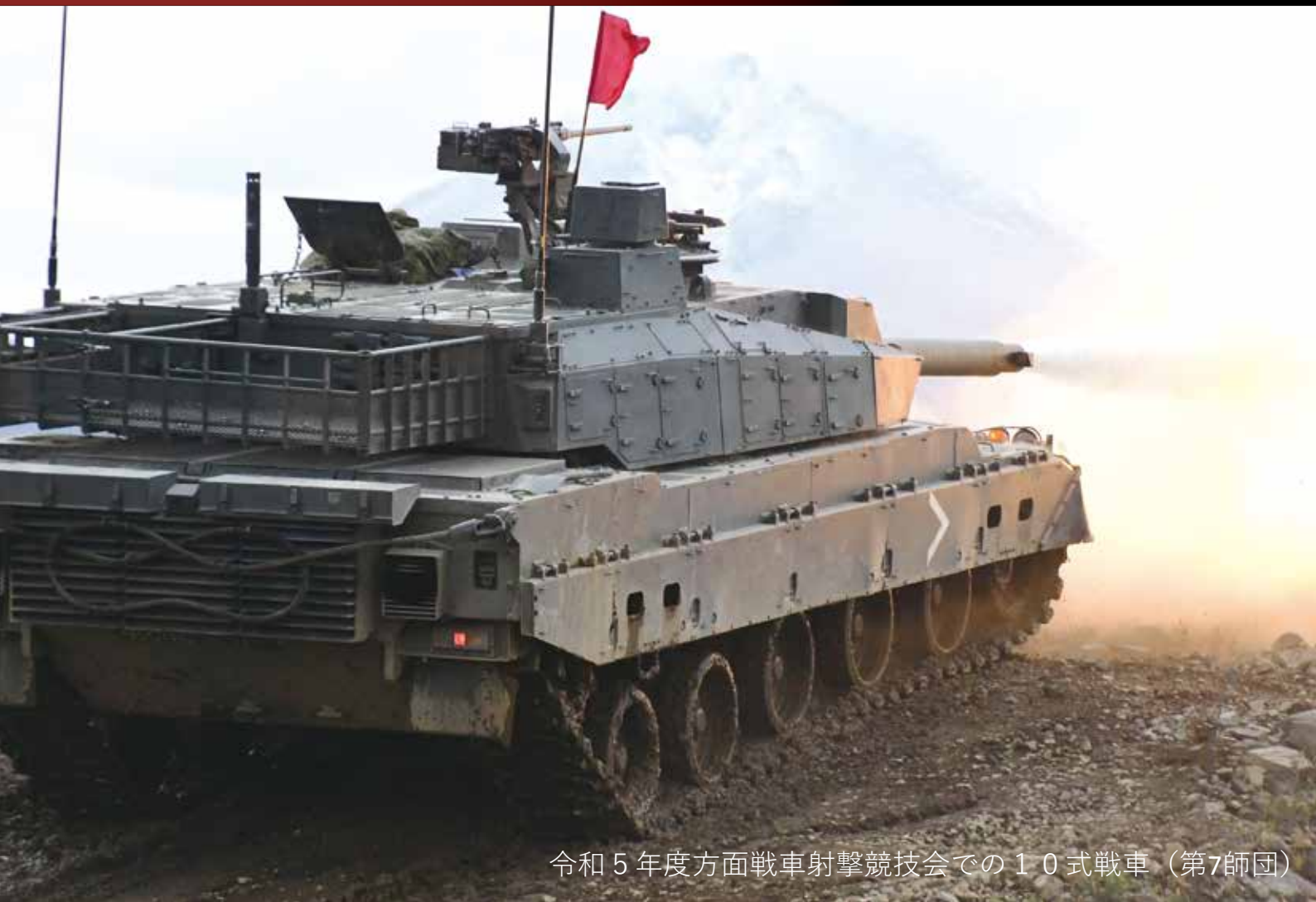
令和5年度方面戦車射撃競技会での10式戦車（第7師団）

札幌市中央区大通西12丁目 札幌第3合同庁舎 TEL 011-272-7579 https://www.mod.go.jp/rdb/hokkaido/