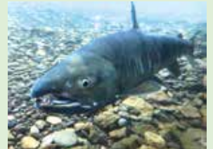
空の玄関口 新千歳空港 千歳水族館から見るサケ