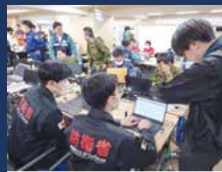
北海道災害対策本部 指揮室運営訓練