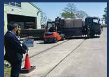
民間企業との 連携状況の視察