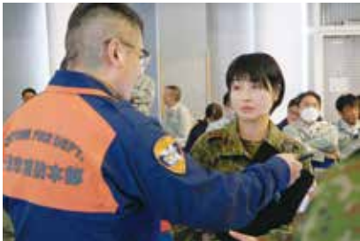
千歳市国民保護訓練への参加

また、千歳JALマラソンの運営協力や千歳音楽まつりの音楽演奏支援を通じて、地域の皆様方との交流を図るとともに、第7師団の活動に対するご理解を深めていただいております。