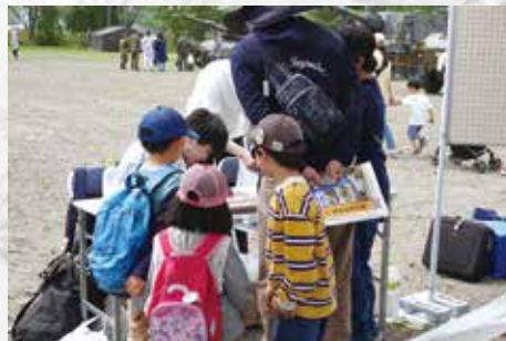
来場者に缶バッチを進呈