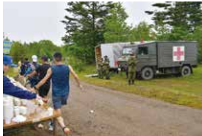
千歳JALマラソンの運営協力