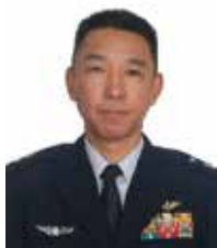
第2航空団司令兼ねて千歳基地司令 空将補 田中 信隆