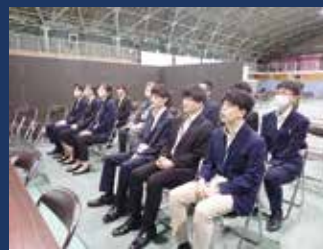
若手職員の訓練見学