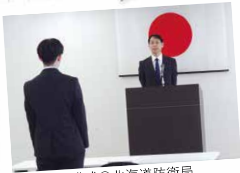
開講式@北海道防衛局

新規採用者は、本研修を通して知識や体験を得ながら、採用者同士での交流も積極的に行い、意欲的に研修に取り組んでいる様子でした。北海道防衛局の一員として、今後の活躍が一層期待されます。