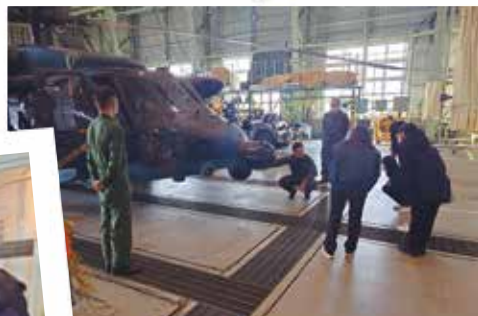
装備品見学@千歳基地