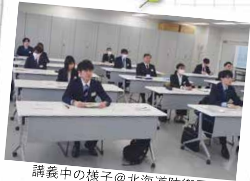
講義中の様子@北海道防衛局