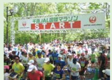
千歳JALマラソンスタートの様子