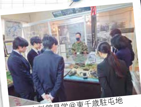
史料館見学@東千歳駐屯地