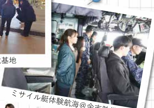
ミサイル艇体験航海@余市防備隊