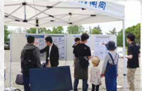
北海道大学の方も展示内容を説明