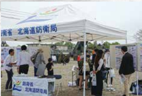
北海道防衛局広報ブース