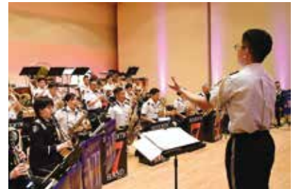
千歳音楽まつりの音楽演奏支援