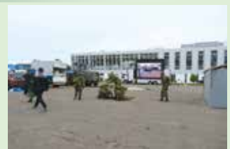
市防災訓練に参加する隊員の方々

隊員の皆様には、地域社会活動への参加をはじめ、千歳JAL国際マラソンや千歳市総合防災訓練をはじめとした市内の各種行事への支援を行っていただいているほか、地域活動への積極的な参加を通じて、地域コミュニティの形成や地域経済の活性化などにも大きな役割を担っていただいております。本市にとって欠かすことのできない存在となっています。