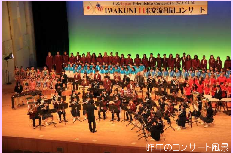
昨年のコンサート風景