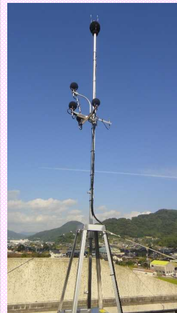
21 町立大島中学校に新たに設置した騒音測定器