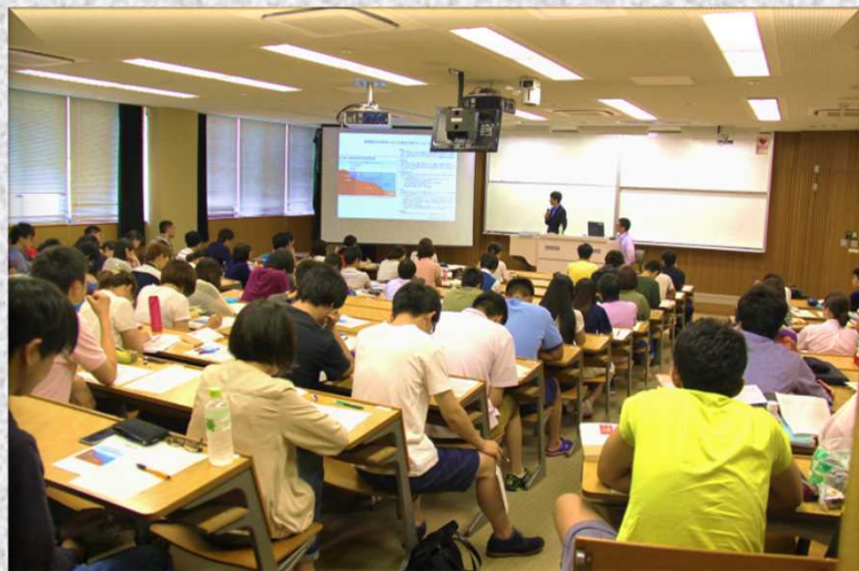
東千田キャンパスにて(7月13日)