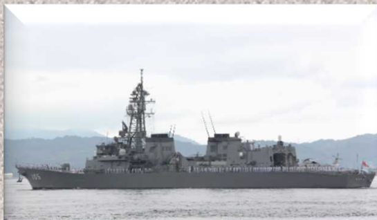
第25次派遣海賊対処行動水上部隊出港