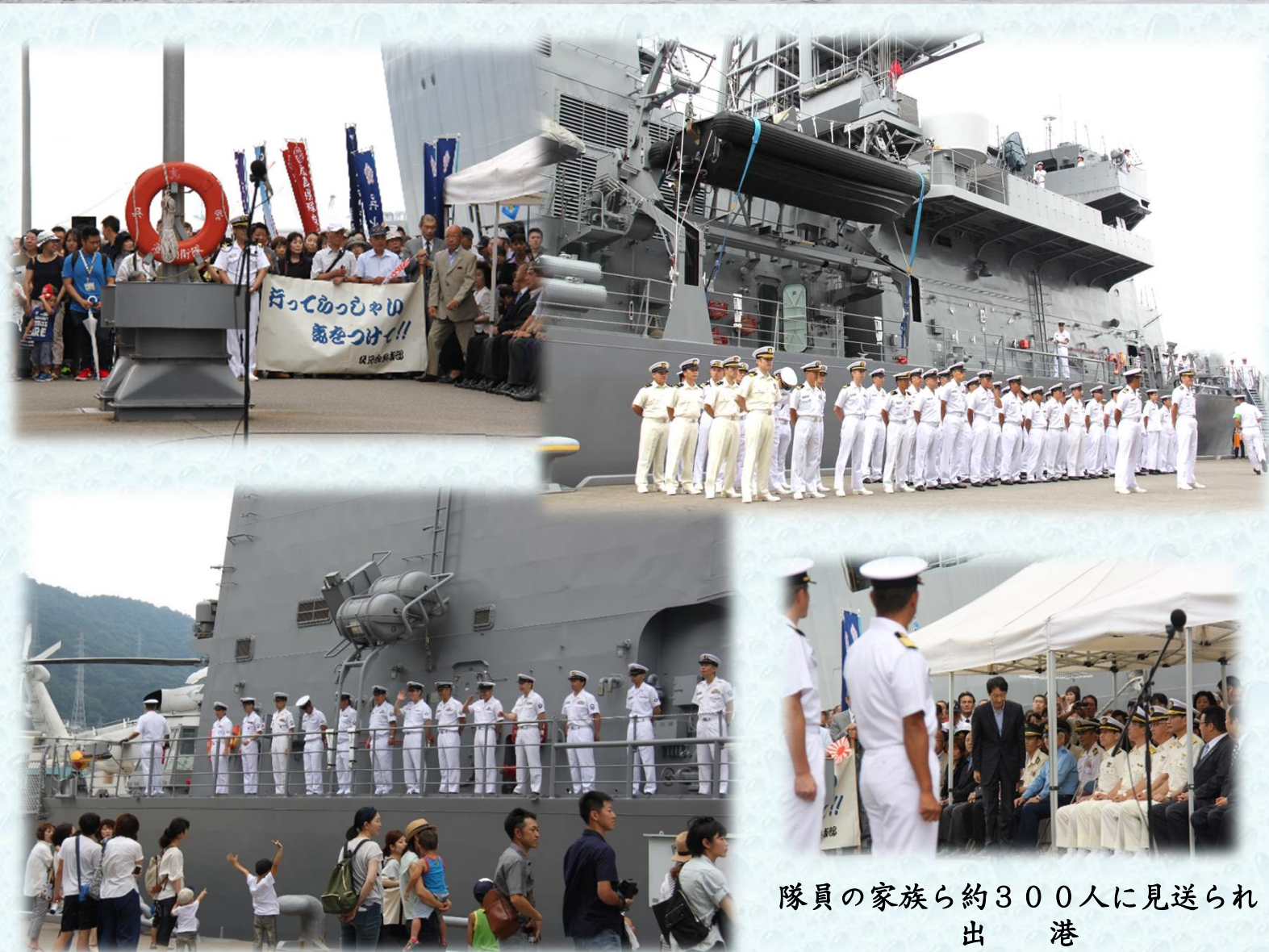
隊員の家族ら約300人に見送られ 出 港

第4護衛艦隊司令の指揮のもと、司令部員30名、いなづま乗員180名と海上保安官4名が乗船し、ソマリア沖・アデン湾において、佐世保を出港した護衛艦すずつま（乗員：210名）とともに、民間船舶の警護や海賊船の対処にあたります。