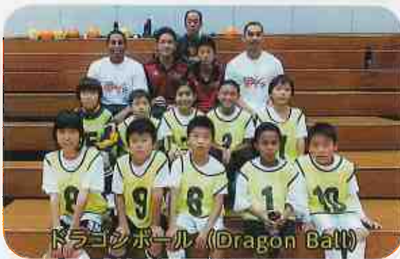
ドラゴンボール (Dragon Ball)