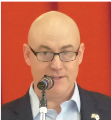
米海兵隊岩国航空基地司令官 ケネス ロスマン大佐

I hope that today's event will serve as a meaningful opportunity for participating students and all attendees to strengthen mutual understanding and forge lasting friendship.