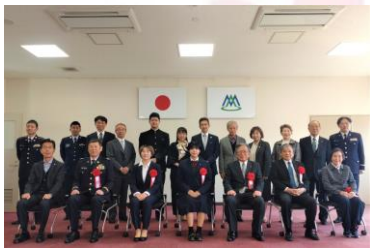
3月7日(金) 南アルプス市