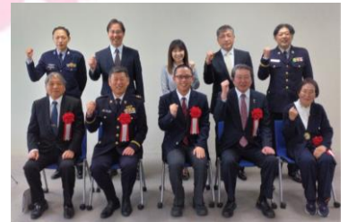
3月6日(木) 市川三郷町

激励会では、来賓の方々から激励や祝辞が送られました。出席した予定者は自衛隊へ入隊・入校する決意を新たにしています。 激励会を主催していただいた皆様にあらためて深く御礼申し上げます。 自衛隊に入隊する皆さん、一緒に勤務する日を楽しみに待っています。今後の健闘を心から祈ります。頑張れ！