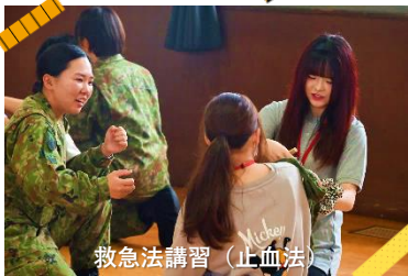
救急法講習(止血法)

昼休みは、隊員食堂において若年層の自衛官と一緒に意見交換会を行いました。有意義な意見交換を実施しつつ頂いた食事は、美味しく栄養バランスも考えられたメニューで大好評でした。 午後からは、北富士駐屯地の装備品展示及び82式指揮通信車の体験搭乗を行いました。一日を通じて「貴重な体験ができた。」「自衛隊に対するイメージが変わった。」などの感想が聞かれました。山梨地本では、今後も「総合的な学習(探究)の時間」に協力し、自衛隊・自衛官についての紹介を通じて、学生の学びに貢献していきます。