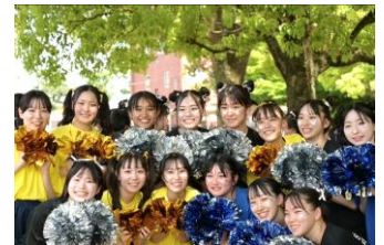
本人前列右から2番目

同期や先輩との生活は楽しいです。高校は文化部だった自分も部活や体力検定のために毎日体を動かしています。一緒に生活しているからこそ、切磋琢磨して頑張れる環境だと思います。