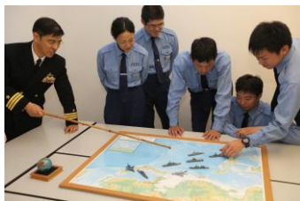
授業風景イメージ

どんな進路を選んでも自分の頑張りようで将来は広がると思いますが、私は自分が選んだ道をみなさんにもおすすめしたいくらい誇りに思っています。地元の後輩ができたなら嬉しいので疑問や不安があったら、お助けできたらいいなと思っています。少し特殊な環境ですが、普通の学校より間違いなく濃くて刺激的な毎日が送れると思います。受験頑張ってください。