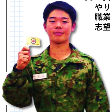
松本候補生 帝京第三高校出身

A 父親が自衛官であり、やりがいのあるカッコいい職業だと父親を見て感じ、志望しました！