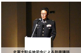
北富士駐屯地司令による防衛講話