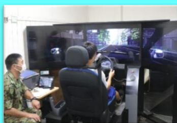
運転シミュレーター