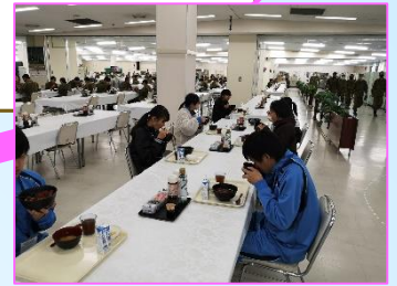
隊員食堂で体験喫食