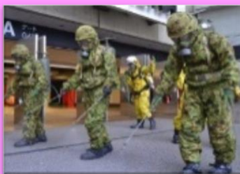
特殊武器防護隊見学