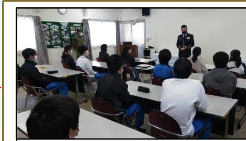
講話（防災・職業） 自衛隊の概要説明