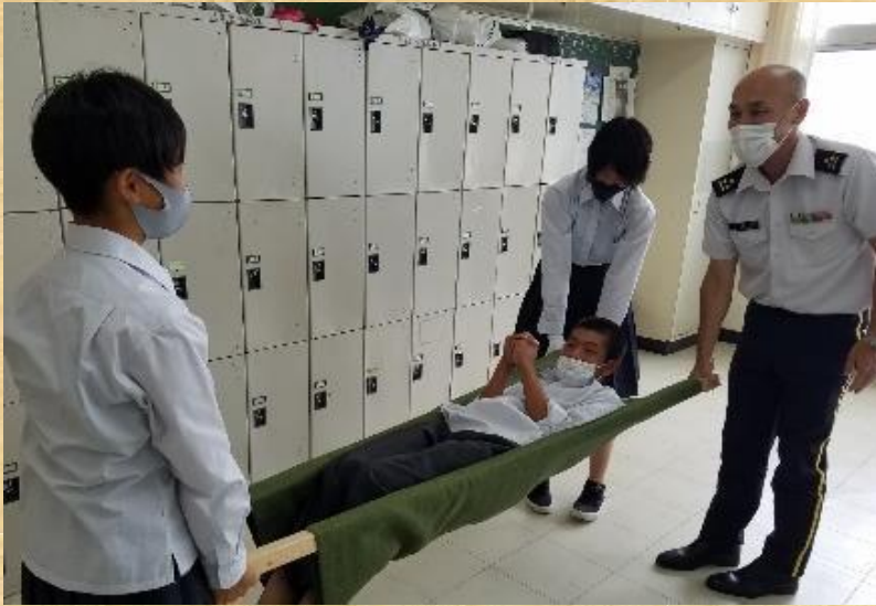
応急担架による患者搬送