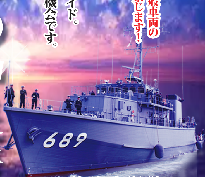
海上自衛隊 掃海艇 MSC-689

「みやじま」とは歴史と山緒ある厳島神社が造営されている、「宮島」にちなんで命名。