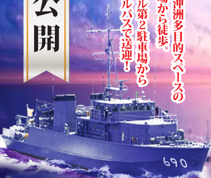
海上自衛隊 掃海艇 MSC-690

Japan Maritime Self-Defense Force MSC-690 "MIYAJIMA"