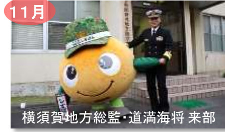
11月 横須賀地方総監・道満海将 来部