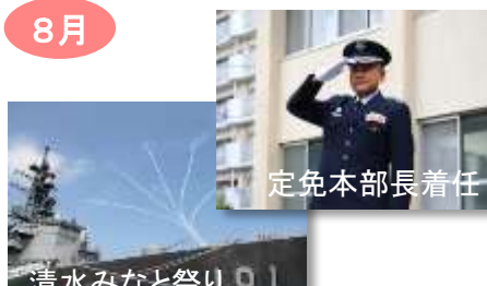
8月 定免本部長着任