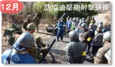
12月 防協迫撃砲射撃研修