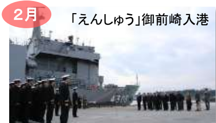
2月 「えんしゅう」御前崎入港