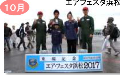
10月 エアフェスタ浜松