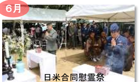
6月 日米合同慰霊祭