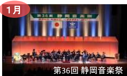
1月 第36回 静岡音楽祭