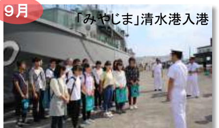
9月 「みやじま」清水港入港