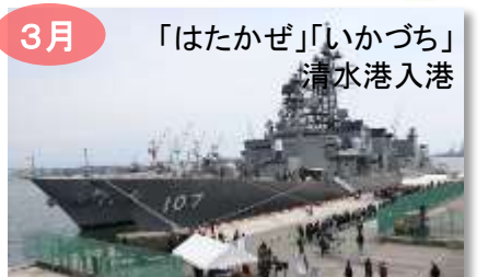
3月 「はたかぜ」「いかづち」清水港入港