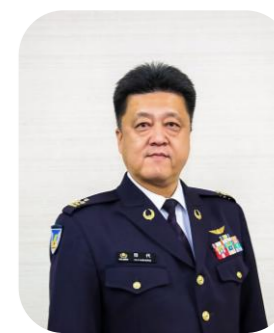
1 等陸佐 本部長 田代裕久

発行 自衛隊静岡地方協力本部募集課 〒420-0821 静岡市葵区柚木366 Tel: 054 (261) 3151