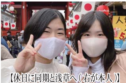
【休日に同期と浅草へ(右が本人)】

学校に入校して、やることを心から願っています。(北海道民が少なく、寂しいです...)