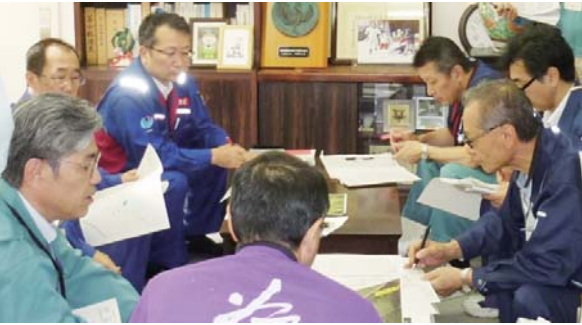
【胆振東部地震時の様子】 厚真町長(正面背中)に対する関係機関からの状況報告(右一番奥が小沼OB)

この地震対応においては、東北6県と新潟県で勤務する退職自衛官が全国協定に基づき、約1か月に亘り支援して下さるとともに、大先輩である道庁非常勤職員の一「危機対策支援員」6名