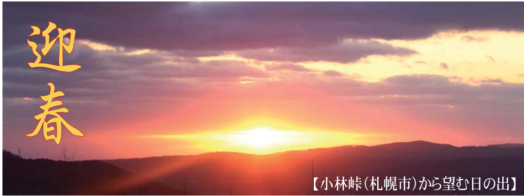
【小林岬(札幌市)から望む日の出】

「とけいだい」をお読み頂いている地域の皆様におかれましては、健やかに新年をお迎えのことと存じます。 昨年、新型コロナウイルス感染症の拡大という未曾有の事態に見舞われた年となりました。同感染症によりお亡くなりになられた方々とご遺族に対し謹んでお悔やみ申し上げますとともに、罹患された方々には心よりお見舞い申し上げます。そ