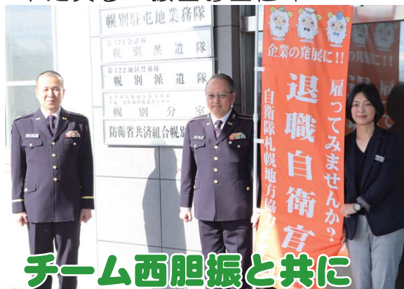
チーム西胆振と共に

登別市緑町3の1 幌別駐屯地内 連絡先TEL 0143-85-2011 (内380)