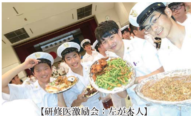
【研修医激励会：左が本人】