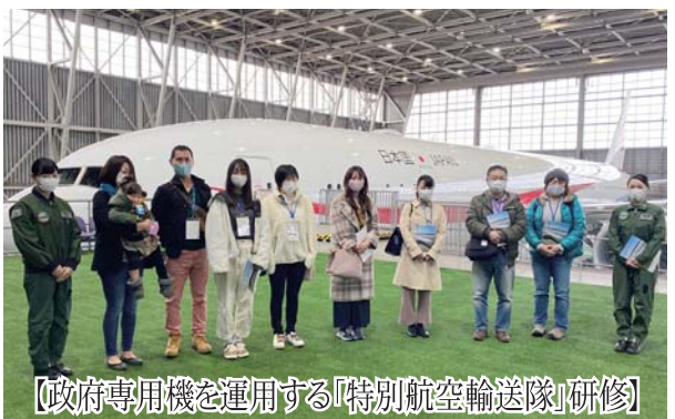
【政府専用機を運用する『特別航空輸送隊』研修】

夕食では、隊内食堂で基地業務群が作る食事を味わっていただくなど、充実した生活環境を実感していただきました。最後の座談会では、若手女性隊員や、入隊予定者と同世代の子を持つ女性最先任上級曹長、夫婦で育児休業を取得した隊員が参加しました。終始和気あいあいとした雰囲気の中、参加者からの積極的な質問などで懇談は大いに盛り上がり、予定していた1時間以上の時間では足りないほどでした。