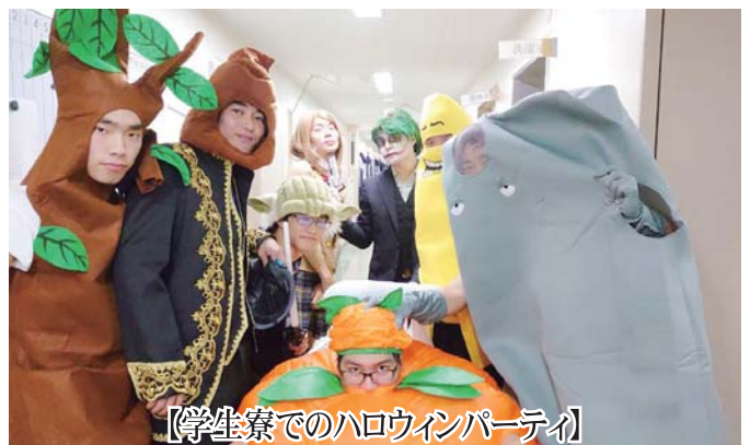
【学生寮でのハロウィンパーティ】