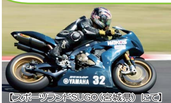
【スポーツランドSUGO(宮城県)にて】

自衛官への入り口である採用広報を担当しています。自衛官の魅力を発信し、自衛隊がより身近に感じてもらえるよう主に市内の学校やイベント等で活動しています。自衛隊の概要説明から受験、入隊手続きまで、マンツーマンでサポートします。