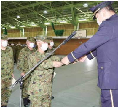
方面総監顕彰状を授与 (札幌地方協力本部長より伝達)

日間外出禁止の泊まり込み。夜間訓練も当たり前前に実施してしました。隊友会の活動も盛んでした。北海道に来てからは、訓練や周りの環境等、東京との違いに唖然としてしまいました。招集訓練を通して多くの知己を得ました。東京にいる頃は仲間と会うことを目的に予備自衛官を続けていた気がします。北海道に来てからは、日本を取り巻く安全保障環境がますます厳しくなり、周辺国の活動やテロも活発化してきている情勢を目の当たりにし、真剣に国防について考えるようになりました。「何かがあれば第一線へ」と。 毎年招集訓練に合わせて身体を作っていました。ここ数年プライベートで精神的に落ち込んだこともあり、トレーニングの質・量共に高い水準を維持することが難しくなっていました。オールドソルジャー・ネバーダイ「古参兵は不死身だ(筆者訳)」を座右の銘として続けてきましたが、そろそろ限界でしょうか。 東日本大震災、あの時ほど予備自衛官として悔しい思いをしたことはありません。当時、たくさんの自衛隊員が災害派遣で活動しました。そして、予備自衛官等制度創設以降初めての即応予備自衛官・予備自衛官の災害招集がありました。これは自分も招集がかかると思いついていました。結局招集はかかりませんでした。弟や息子は現役の自衛官として現場に出ているのに何故予備自衛官の私は出られないのか、というものがしっくり思いつきませんでした。大