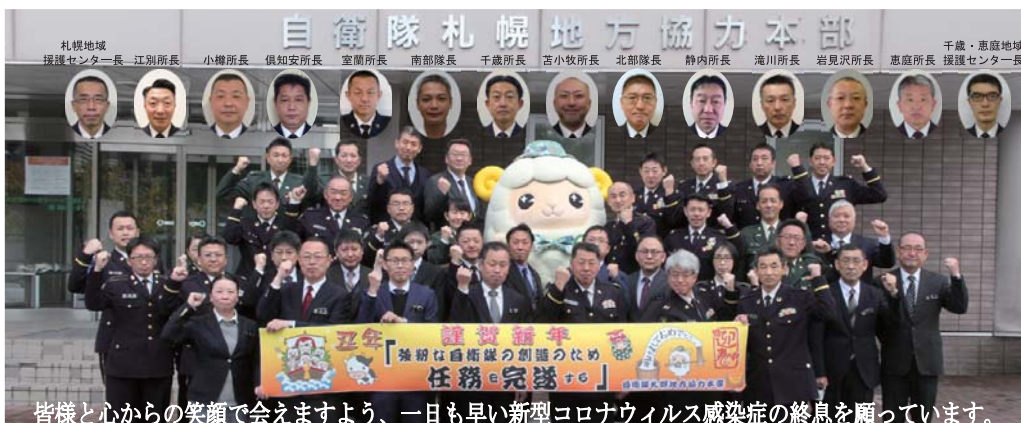
皆様と心からの笑顔で会えますよう、一日も早い新型コロナウイルス感染症の終息を願っています。