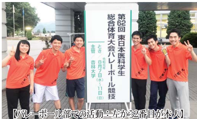
【バレーボール部での活動：左から2番目が本人】

本校で過ごして来て、最初は慣れないこともありましたが、自衛官としての教育があることは確かですが、しっかり医学生であり、しっかり大学生であることには間違いないので、ぜひ本校に興味を持っていただけると幸いです。