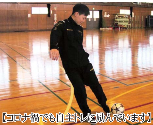
【コロナ禍でも自主トレに励んでいます】

現在は、青森県むつ市にある第二十五航空隊 通信班に所属し、電子整備員としてネットワーク環境の維持整備等を行っています。また、配属されて日も浅く、わからないこともたくさんありますが先輩が優しく教えてくれ、日々勉強しながらとても充実した毎日を送っています。いち早く戦力となれるよう今後も、技量向上を目指し自己研鑽していきます。