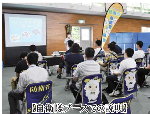
【自衛隊ブースでの説明】