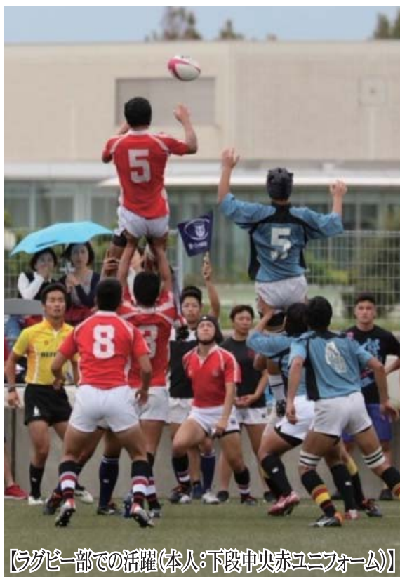
【ラグビー部での活躍(本人:下段中央赤ユニフォーム)】

に、かけがえのない同期の絆 を得られたことに対して、 「防大に来て良かったな」と 思っています。ですから、みな さんも安心してください。 思い出深い行事としては、 夏季定期訓練があります。 この訓練の最終日には、海で 8kmの遠泳をします。着校時 は25mを泳ぐのが精一杯だっ た私が、同期とともに様々な 困難を乗り越え、この8kmを 泳ぎ切れた時の達成感はい とおでした。この感動は、防 大以外では、到底得られるも のではなかったと思います。他 にも、秋季定期訓練の夜間 訓練中に目にした富士山や 星空、同期だけの野営等、す べてがかけがえのない素晴ら しい思い出ばかりです。 防大の環境は、一般の大 学と比べると厳しい一面もあ ると思います。その瞬間には 意味が分からなかったり、理 不尽に思えてしまうこともあ ります。しかし、求められたり 指示されることのすべてに合 理的な理由があり、自らの成 長へとちゃんと繋がっていま す。そして、ここでしか得るこ とができない経験や思考法 などもたくさんあります。私 はこの道に進む道産子が増 えることを願っています。