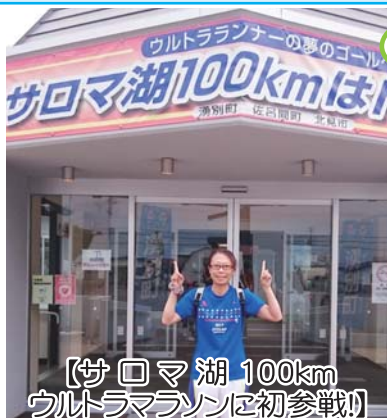
【サロマ湖100km ウルトラマランに初参戦!】