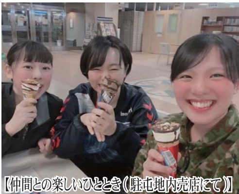
【仲間との楽しいひととき(駐屯地内売店にて)】