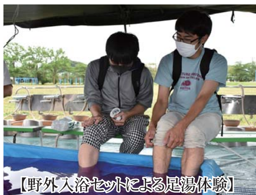
【野外入浴セットによる足湯体験】