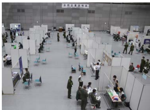
密を回避し、感染対策を充分に取った会場。ブースの間隔を充分とり、説明会場数を増やしました。

札幌地本は今後も隊員が希望する企業に自信をもって就職できるような万全の援助をしていきます。