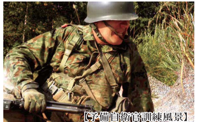
【予備自衛官訓練風景】

です。2018年9月に発生した北海道胆振東部地震に伴う災害派遣の救助活動について、招集訓練の際に見た教育用DVD等により、一般のカメラマンが同行できないような厳しい災害現場での救助活動の状況など、メディアでは放送されていない状況も知りました。さらに即応予備自衛官が招集され、現地で支援を行った際の広報を拝見し、『国防意識』がより一層強くなりました。