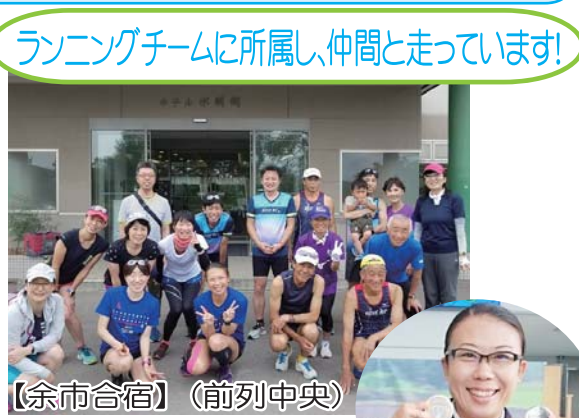
ランニングチームに所属し仲間と走っています!