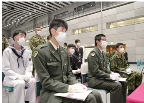
説明を聞く参加隊員

自衛隊札幌地方協力本部は、7月28日(火)札幌コンベンションセンターにおいて、令和2年度1回目となる任期制隊員合同企業説明会を実施しました。