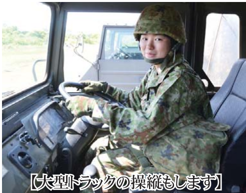
【大型トラックの操縦もします】

陸上自衛隊に入隊する 私が陸上自衛隊に入隊しようと思った理由は、東日本大震災の際、災害派遣任務についている自衛官の姿に憧れたからです。また、私は母子家庭で、母の手一つで育てられてきたので、母親を安心させたかったからです。そのため、高校卒業後は母親を安心させることができるとような安定した仕事・給料を得ることができると先を探していたところ、自衛官という職業を知り、魅力を感じたため、入隊することを決意しました。