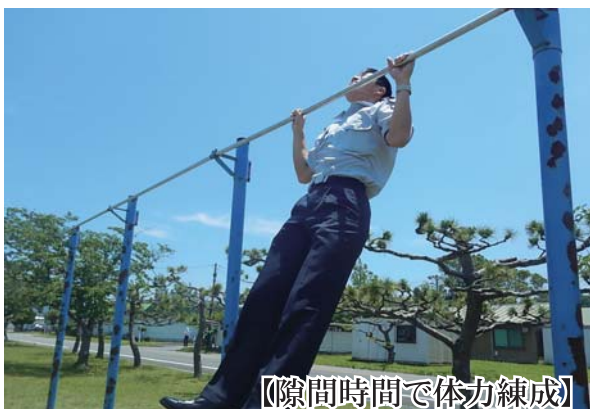
【隙間時間で体力練成】

どで不安がある人は多いと思います。だから、安心して下さい。戦闘操縦者である教官からの教育等で、能力は十官から教育を受け、その姿は本当に格好よく、やりがいのある職業だと感じていきます。一緒に頑張りましょう。