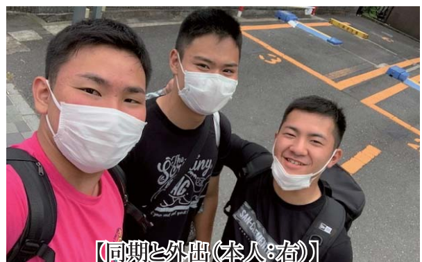
【同期と外出(本人:右)】