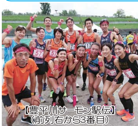
【豊平川サーモン駅伝】 （前列右から3番目）