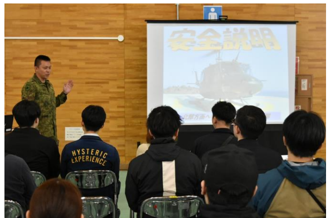
UH-1の性能や搭乗前の安全教育