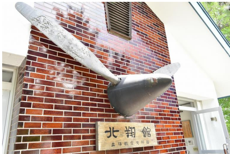
丘珠駐屯地 史料館