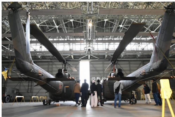
後方からの展示ヘリ