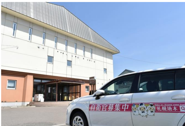
安全教育会場 丘珠駐屯地厚生センター

札幌地本は、引き続きさまざまな広報活動を行い、自衛隊をより身近に感じていただけるような活動を継続していきます。