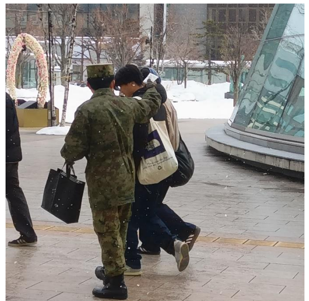
募集対象者へティッシュ配布