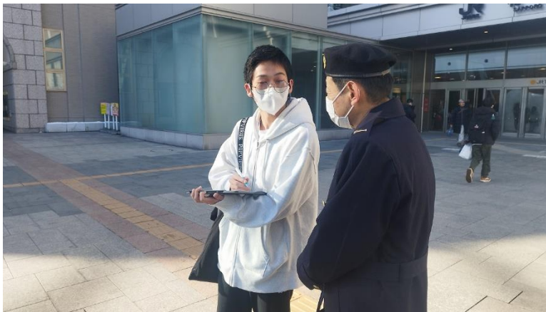
アンケートの実施その1