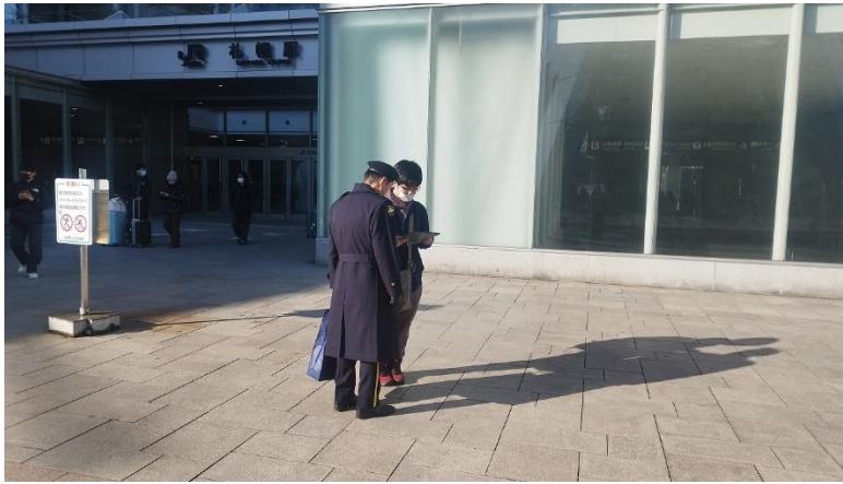
募集対象へ声掛け