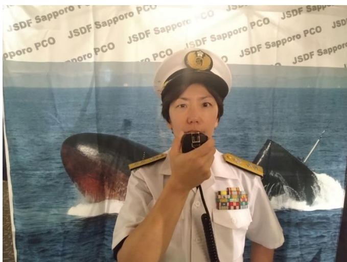
主人公「海江田将補」仕様制服 1