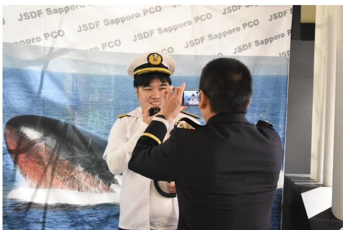
S N S への投稿の様子