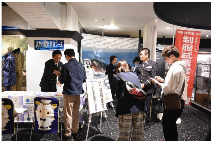
「沈黙の艦隊」特設ブース