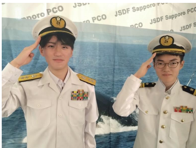
主人公「海江田将補」仕様制服 2 (左)