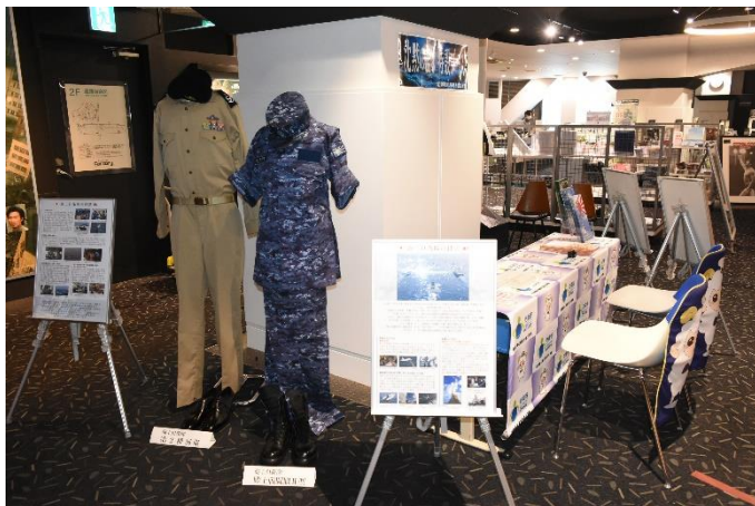
海上自衛隊の被服の展示