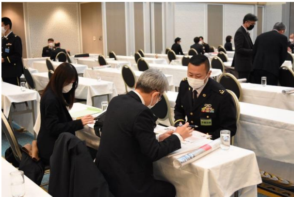
個別相談の様子④ 対応者：予備自衛官課総括長