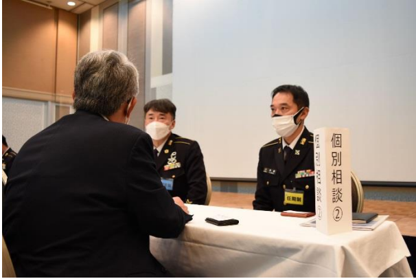
個別相談の様子② 対応者：札幌地域援護センター援護担当官