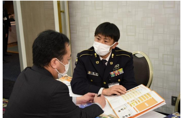
個別相談の様子⑦ 対応者：募集課広報官