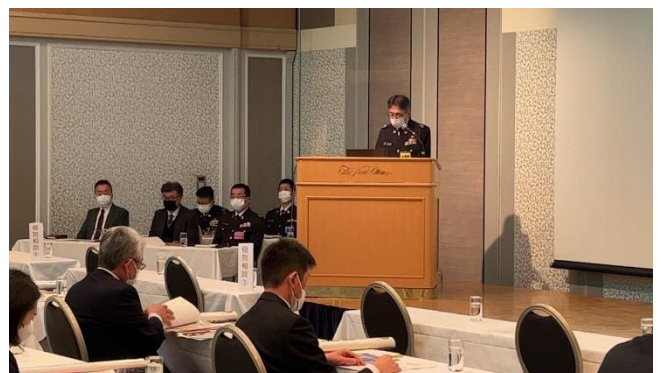
退職自衛官の雇用ガイド（自衛隊新卒）を説明する 札幌センター任期制係長