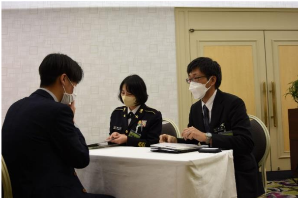
個別相談の様子⑥ 対応者：予備自衛官課即応予備自衛官班担当者