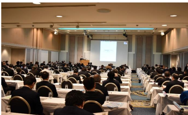
札幌地域援護センター長挨拶

札幌地方協力本部は、企業開拓を推進し、各企業と隊員のニーズをマッチングさせ、次年度の退職隊員増加に対応する就職援護基盤の充実を図り、自衛隊の入口（入隊）は「募集課」出口（再就職）は「援護課」を合言葉に業務にまい進していきます。