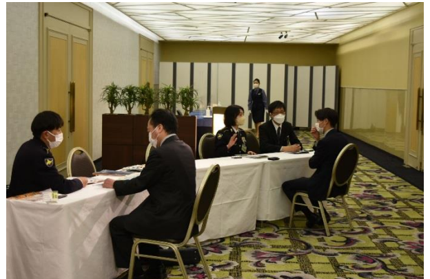
個別相談の様子⑤ 対応者：募集課広報官（手前）、予備自衛官課即応予備自衛官担当（奥）