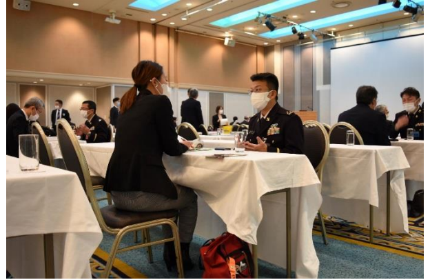
個別相談の様子③ 対応者：札幌センター長（左奥）、援護班長（中央）、札幌センター援護担当官（右奥）