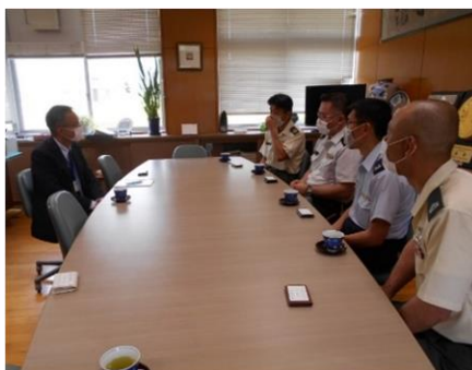
伊万里農林高校表敬訪問の様子