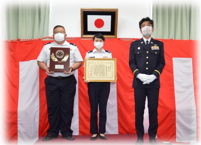
第1級賞状受賞を紹介する本部長