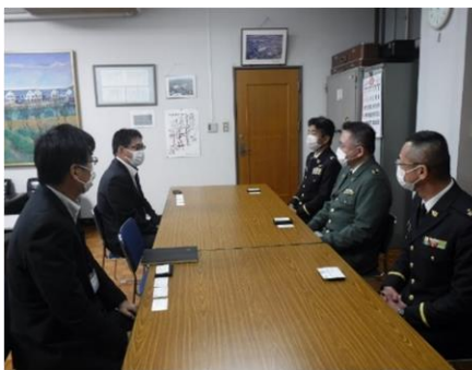
神埼高校表敬訪問の様子

佐賀地本は、4月6日(月)から6月23日(火)の間、県内43校の高等学校長に対する表敬訪問を実施した。折からの新型コロナウイルス感染拡大の影響により、各校校からも対応に追われる大変多忙な中であったが、快く対応していただいた。 訪問では、担当所長及び担当広報官が同席し、本部長より、令和元年度の志願から入隊までの謝意を述べるとともに、今年度の募集の状況と引き続きの協力をお願いした。また、高校時代の恩師である校長先生への懐かしい思い出話に盛り上がる等、非常に和やかな雰囲気であった。 佐賀地本は、「今後も自衛官等募集に対する理解をよき一層深めていただけるように努め、募集強化を図っていく。」としている。