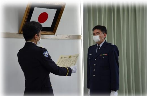
第5級賞状 武雄地域事務所