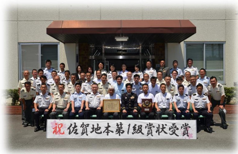
第1級賞状受賞記念 本部