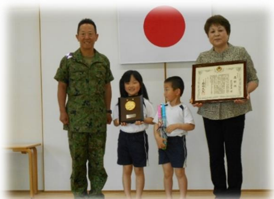
幹部候補生学校長による感謝状贈呈 (5月27日(水) 武雄町 武内保育園)