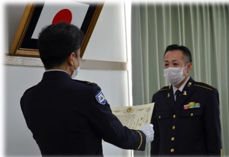
第5級賞状 武雄所 大宅1陸曹