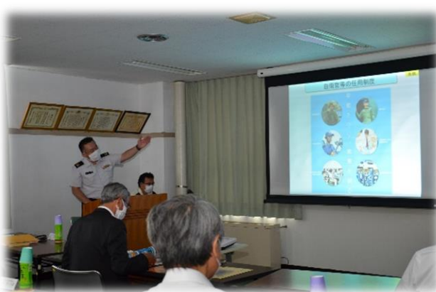
学校長に対する募集制度説明会 (7月2日(木) 本部)