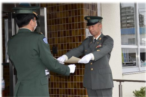
第4級賞状 総務課 立川2陸曹