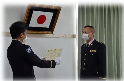
第4級賞状 鳥栖地域事務所