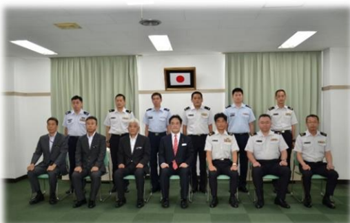
地本部員との記念撮影