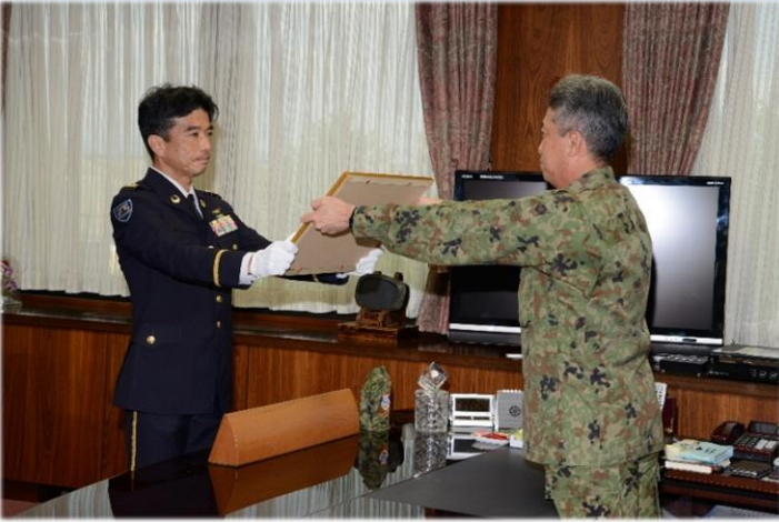
西部方面総監より第1級賞状を受け取る本部長

佐賀地本は、この度防衛大臣より、募集広報活動等への功績による「第1級賞状」を受賞した。 6月22日(月)、本部長は、西部方面総監部において方面幕僚長及び幕僚副長陪列のもと、方面総監より「第1級賞状」の伝達を受けた。 今回の「第1級賞状」は、全国で4個地本が受賞したが、佐賀地本が受賞するのは、先回受賞した昭和50年5月以来、実に45年ぶりの快挙であり、これまでの募集・援護・予備自衛官等業務の成果のみならず、隊務運営に真摯に携わってきた多くの部員の地道な努力と活動の積み上げが結実したものである。 佐賀地本は、「この受賞を励みに、今後も募集・援護・予備自衛官等の機能を「ワンチーム」として、それぞれが掲げる目標を達成できるように、地道に活動を積み上げていく。」としている。