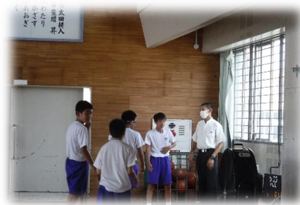
高等工科大学校生徒による母校訪問 (8月4日(火) 城東中学校)