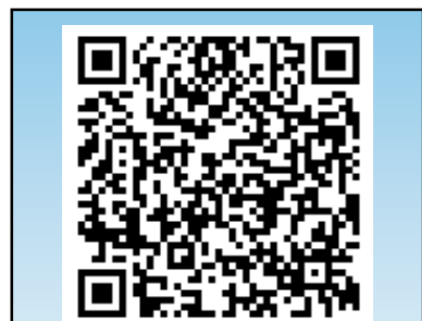
ログイン用QRコード