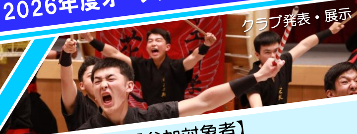
クラブ発表・展示

【参加対象者】 高工校に興味のある方は どなたでも参加できます！ ※ 内容は変更となる場合があります