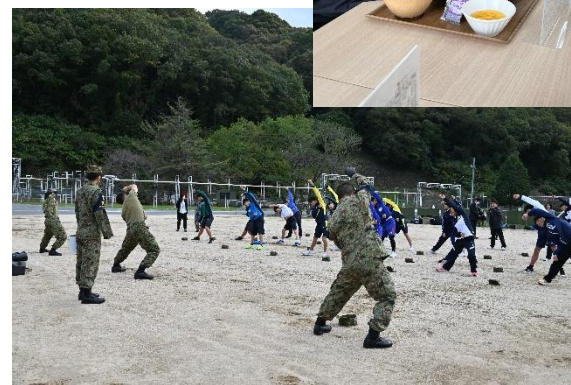
食事後は、グラウンドに出て自衛隊体操を体験