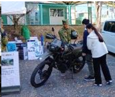
偵察用オートバイ