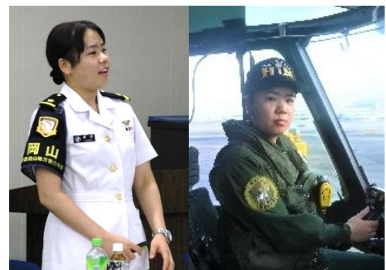
自衛隊パイロットによる体験談