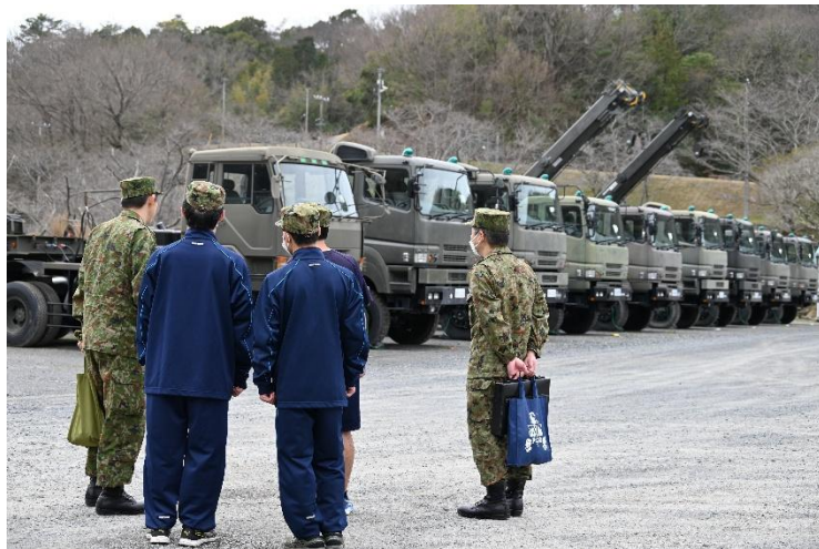
駐屯地の施設や駐車場などを見学