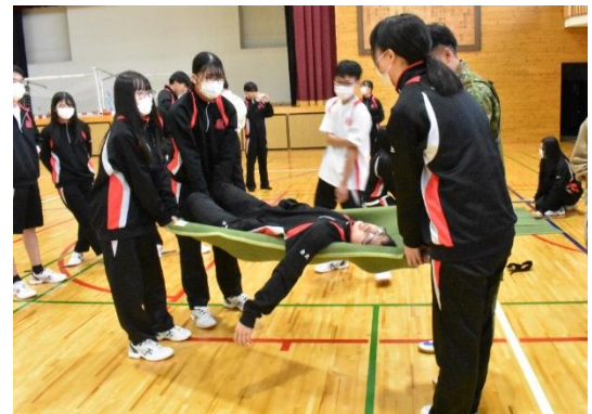
簡易担架での搬送を体験