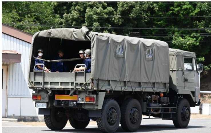
自衛隊車両に試乗