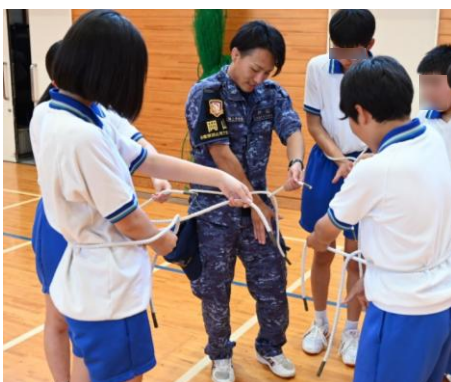
自衛隊式ロープワークを体験