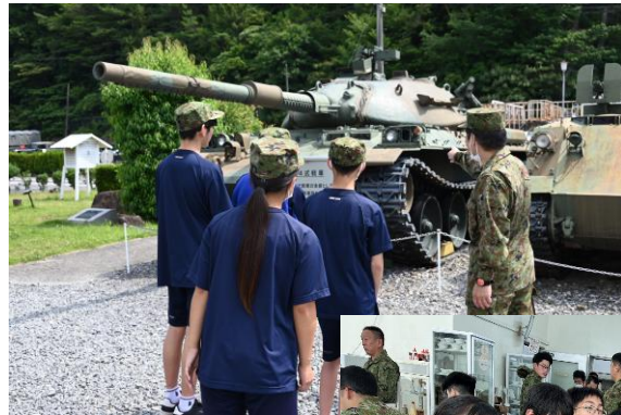
(左) 戦車の説明を受ける生徒たち