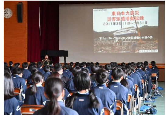
災害派遣の体験談

東日本大震災、西日本豪雨等に伴う災害派遣活動の事例をパネルやスライドを使い説明します。