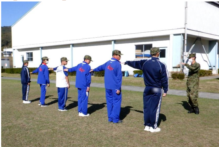
整列の仕方や方向変換などの基本動作を体験