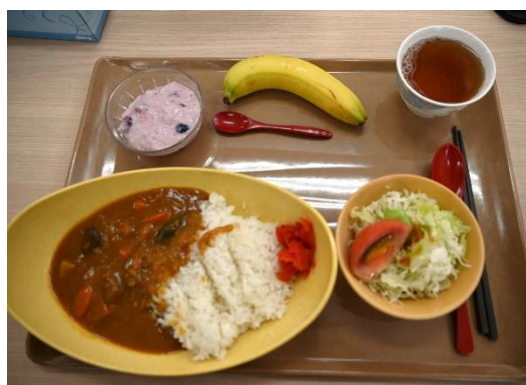
栄養満点！駐屯地メニュー