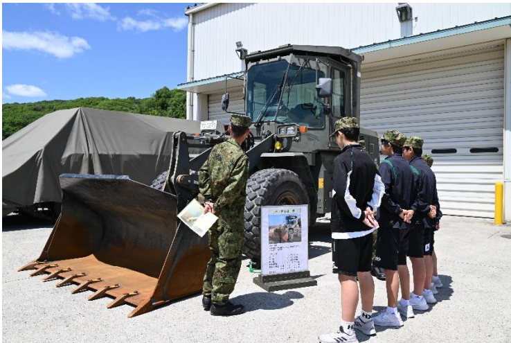
災害派遣活動などに従事した装備品を見学