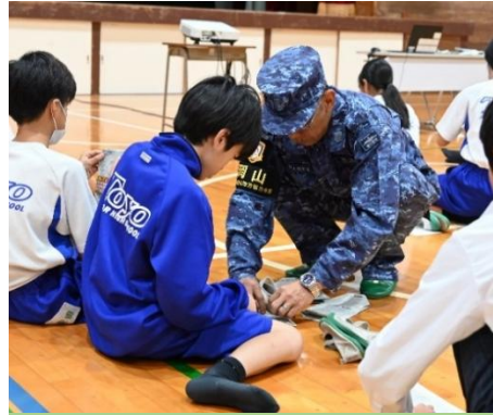
新聞紙でスリッパを作る様子