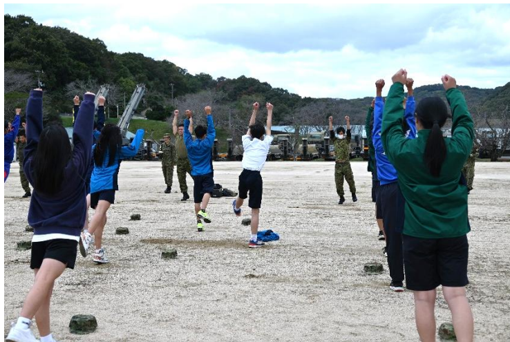
自衛官と一緒に体操を体験