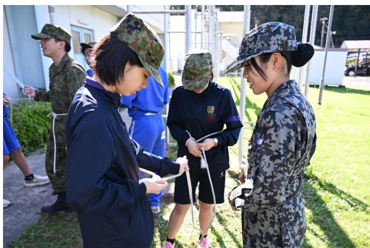
自衛隊式ロープワークを体験