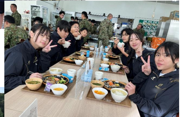
(下) 自衛隊の食堂で楽しく食事