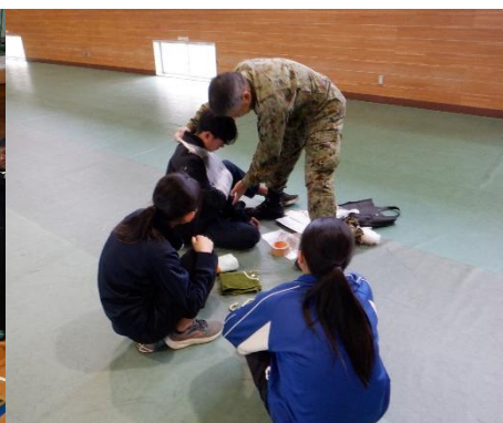
日用品を使った応急処置