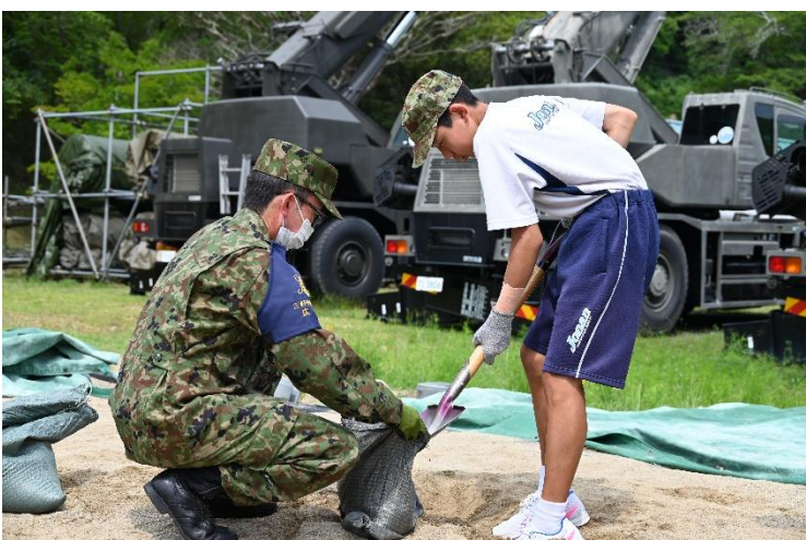
自衛隊式土のう作成法を体験