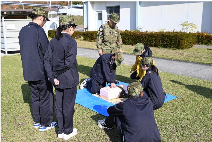
AEDの操作、止血の仕方、応急担架の作成