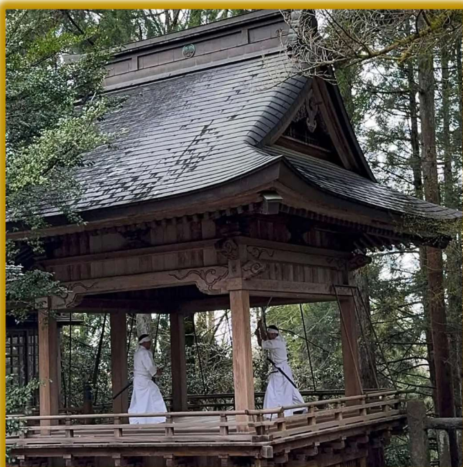
演武の写真