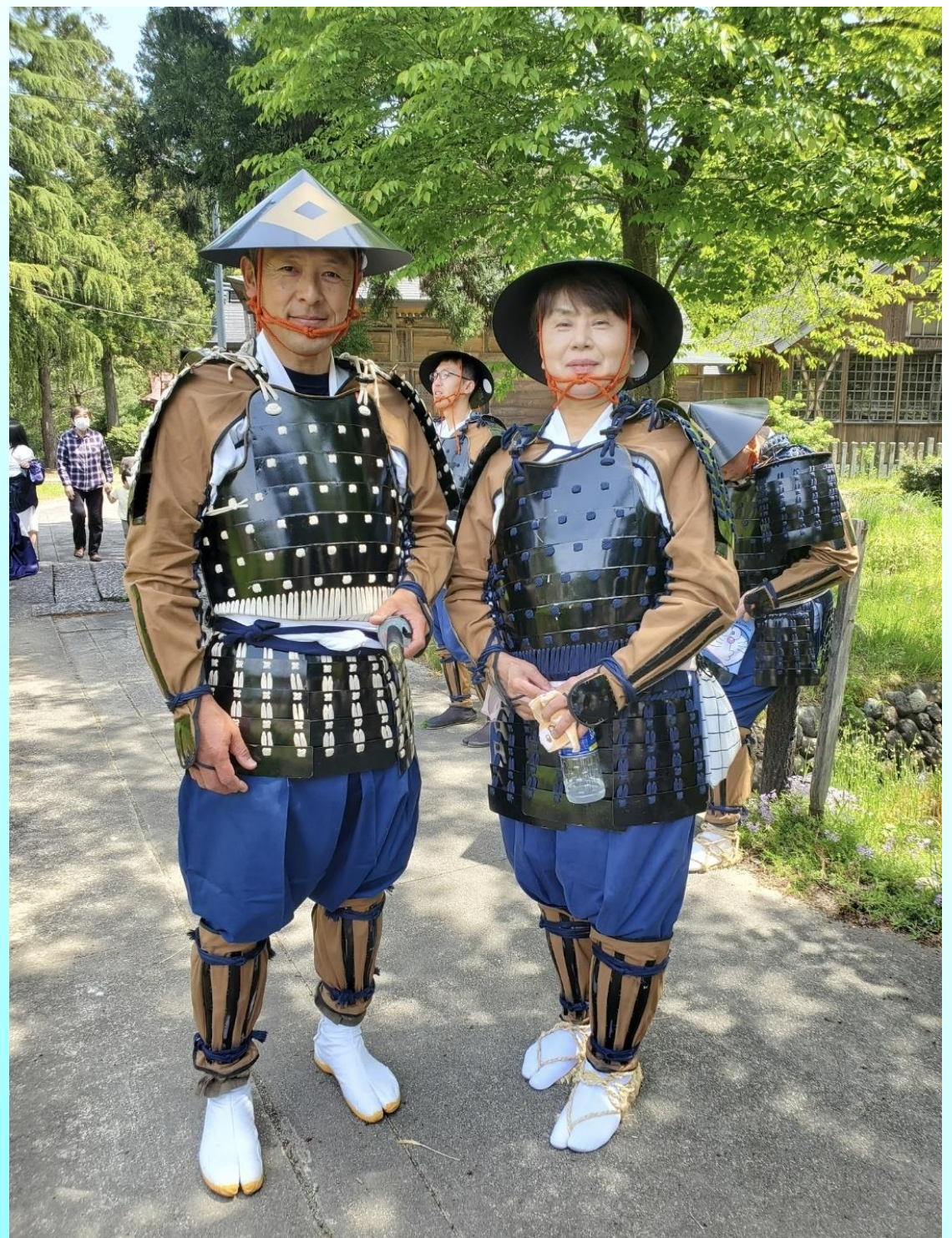
記念写真1 五泉市長（右）